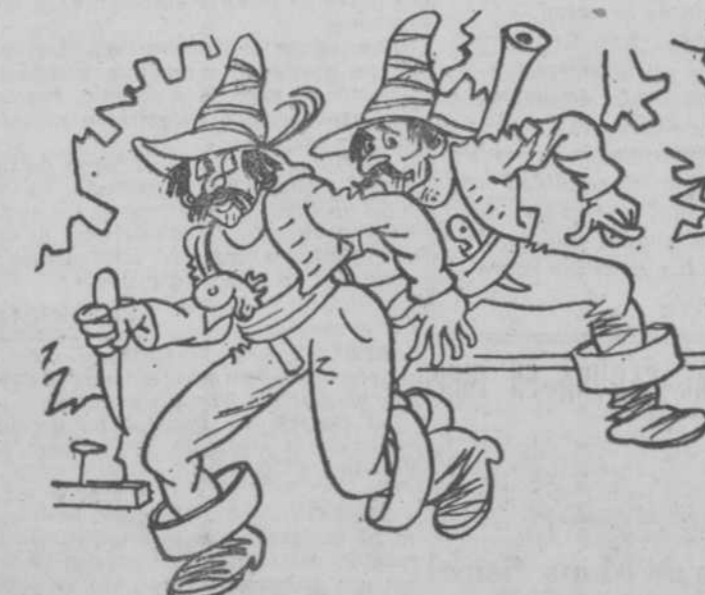
LOS BANDIDOS (en escena).—¿Estamos solos? UNA VOZ DEL PUBLICO.—Casi.

TONICO NERVIOSO Y MUSCULAR INSUSTITUIBLE. TUBERCULOSIS, ANEMIA, NEURASTENIA, CONSUNCION