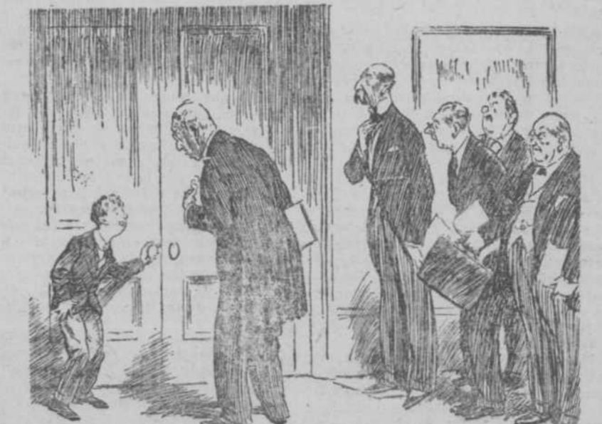
EL BOTONES (al presidente del Consejo de Administración).—Perdone el señor, pero desearía que no olvidasen ocuparse en Consejo de mis vacaciones.