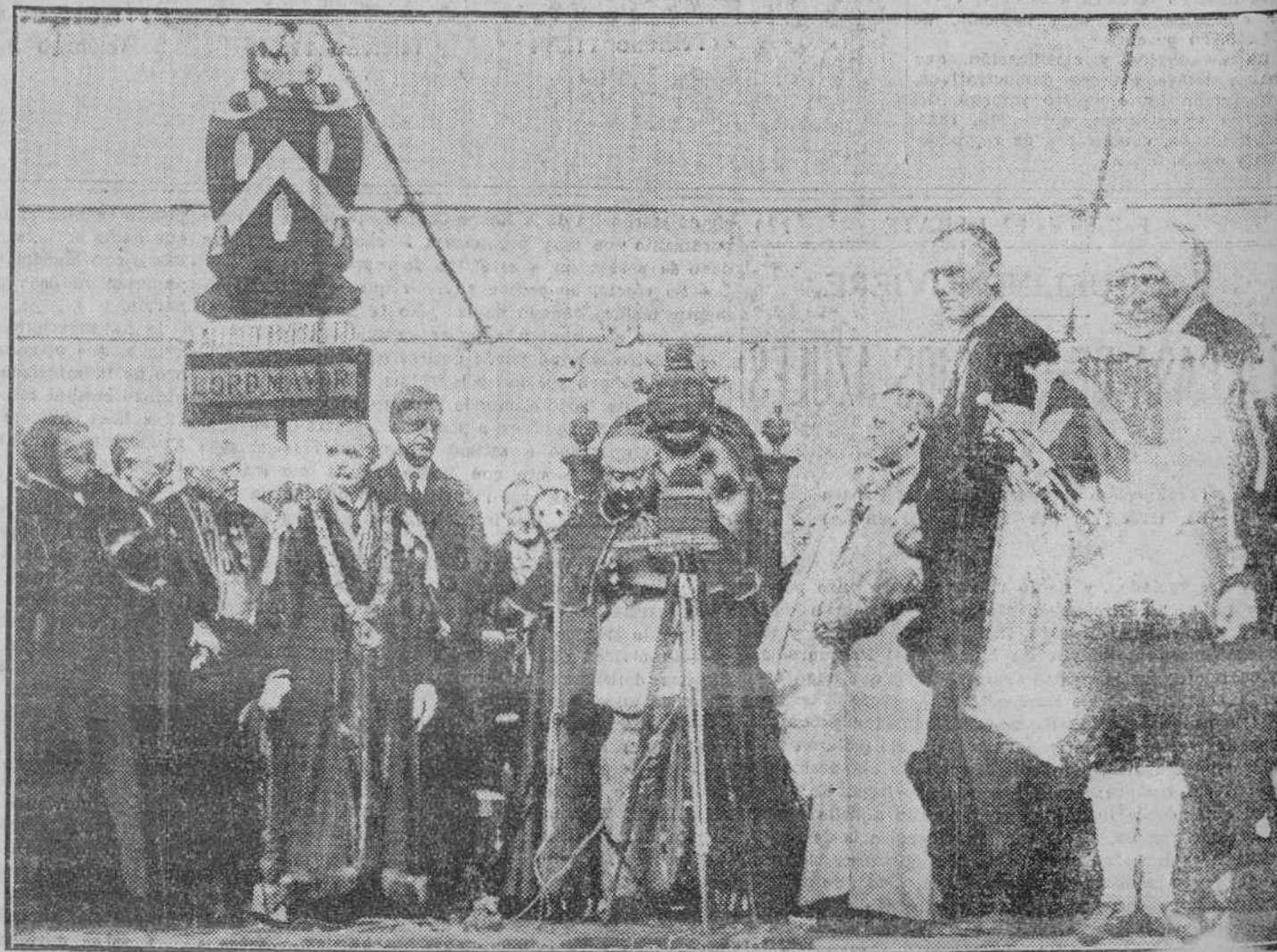
El Legado pontificio, ante el micrófono, saluda a los congresistas de todos los países. El poderoso mano de difusión transmite a los católicos palabras de paz y de consuelo. Las más altas autoridades del pueblo irlandés, detrás del Legado, señalan la adhesión completa de Irlanda a la gran manifestación de fe católica que se celebra