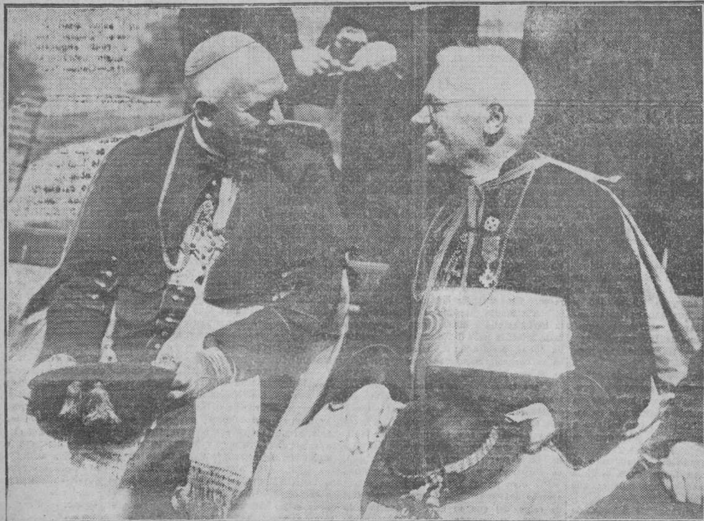
En animada conversación, el representante del Papa con el Obispo alemán monseñor Berning. Los dos felices encarnan los sentimientos de fraternidad entre los pueblos reunidos en el Congreso Eucarístico

Los teléfonos de EL DEBATE son los números: 91090, 91092, 91093, 91094, 91095 y 91096