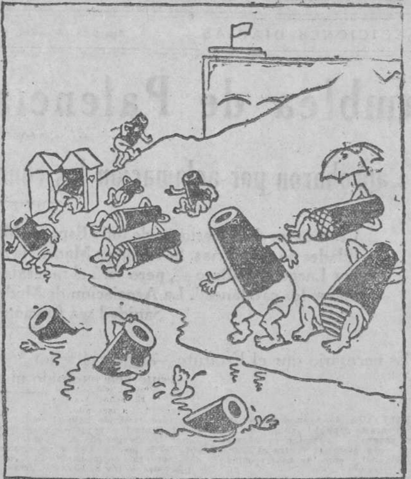
LAS PLAYAS DE GINEBRA