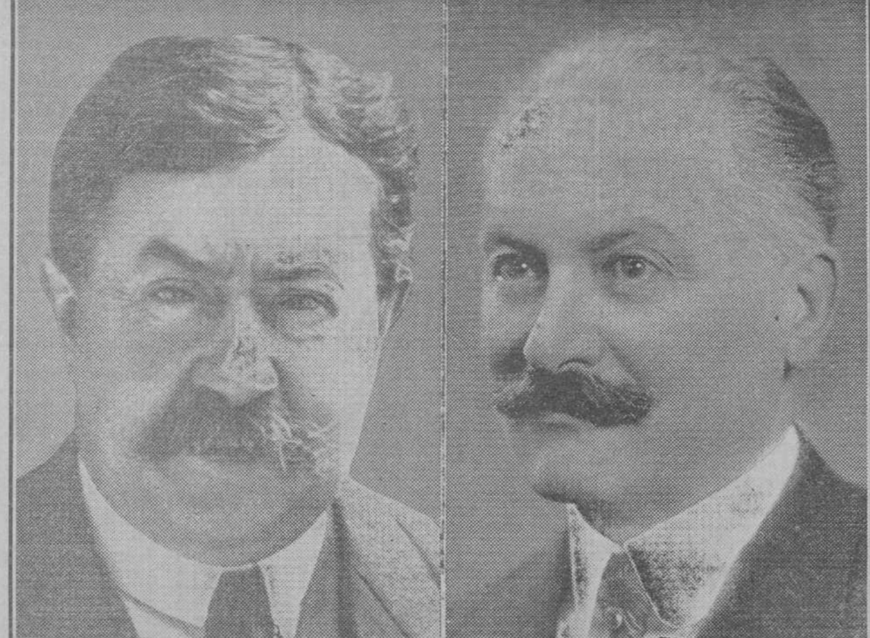
El ex presidente del Consejo, Painlevé, y el presidente del Senado, Lebrun, las dos figuras de la elección presidencista l francesa