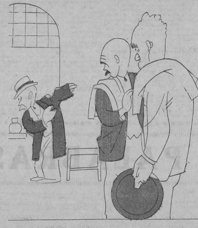
— Es bravo como él sólo. Hizo toda la guerra de Cuba, la de Marruecos, y ahora ha puesto un estanco.