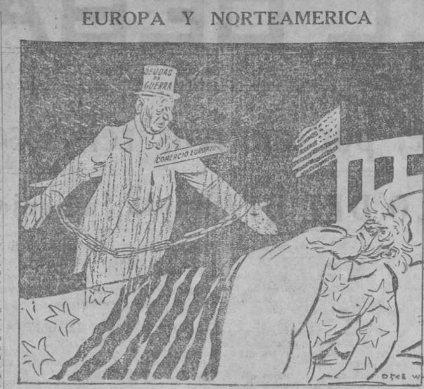
LOS FANTASMAS QUE VE EL TIO SAM

—Tiene usted una letra muy confusa. ¿Por qué no escribe usted a máquina sus poesías? —Pero... ¿pero usted se cree que yo me dedicaré a hacer poesías si supiera escribir a máquina? —¿Hummer!, —Hamburgo) —Las tres de la mañana y aún no ha venido a acostarse... —¿Sivergüenza!