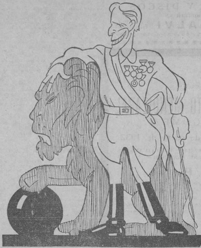
¿A ver si tiene más éxito el domador!