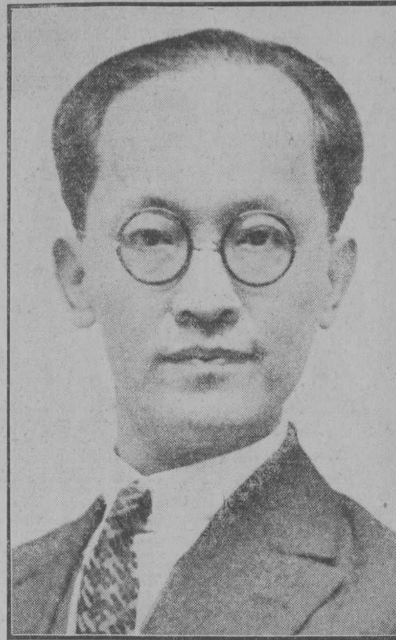
El doctor Sun Fo, nuevo presidente del Comité Ejecutivo de China

Un desfile continuo por el Gobierno civil. Ha llegado el momento, dice Maciá, de que la Generalidad y la Esquerra fijen sus posiciones. El gobernador insiste en dimitir. La Esquerra no ha recibido todavía oferta ninguna sobre el cargo