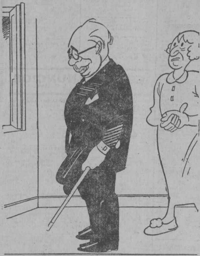
Gabinete encontraría en seguida; pero, amigo, tiene que ser uno donde quepa el tresillo socialista.