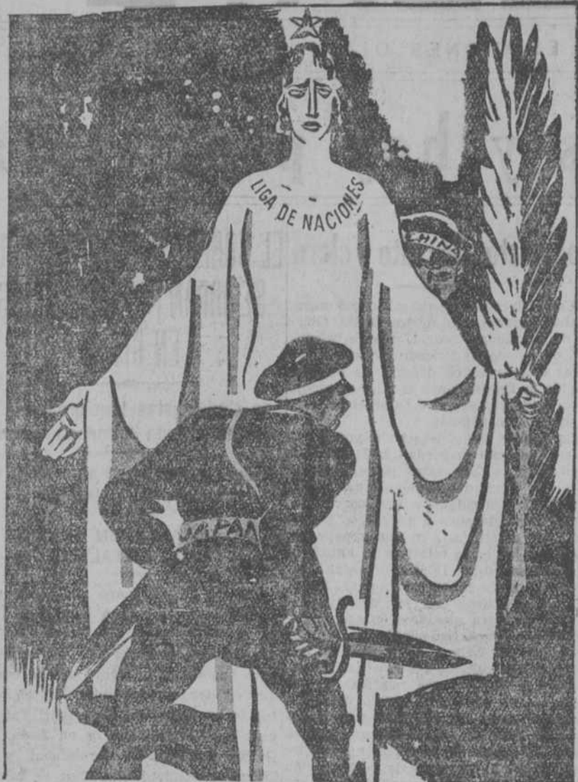
EL JAPON.—Atraveso o doy la vuelta. (De "Notenkraater", Amsterdam.)