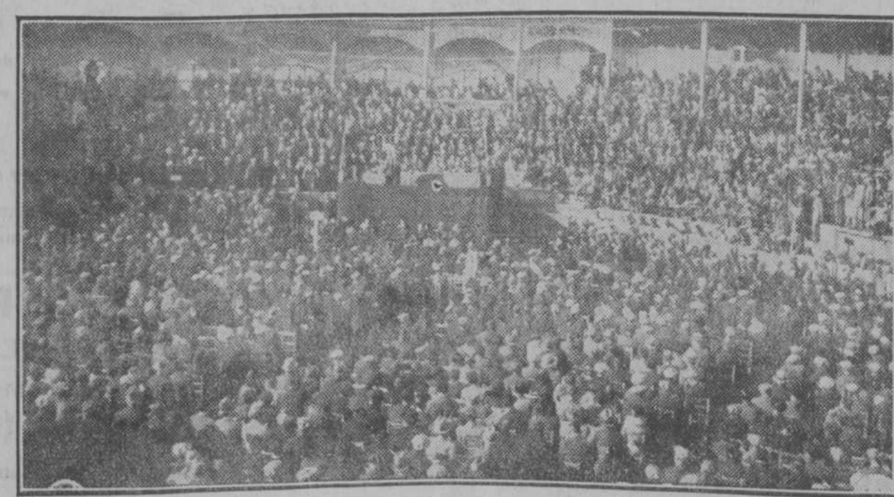
He aquí un aspecto de la plaza de toros de Vich, el domingo, 13, durante el discurso de Gil Robles. 10.000 personas en cálida manifestación de entusiasmo, pese a las amenazas de disturbios y a las falsas noticias circuladas sobre la suspensión. Un acto magnífico de fervor y de ideal, y un hermoso ejemplo de los católicos