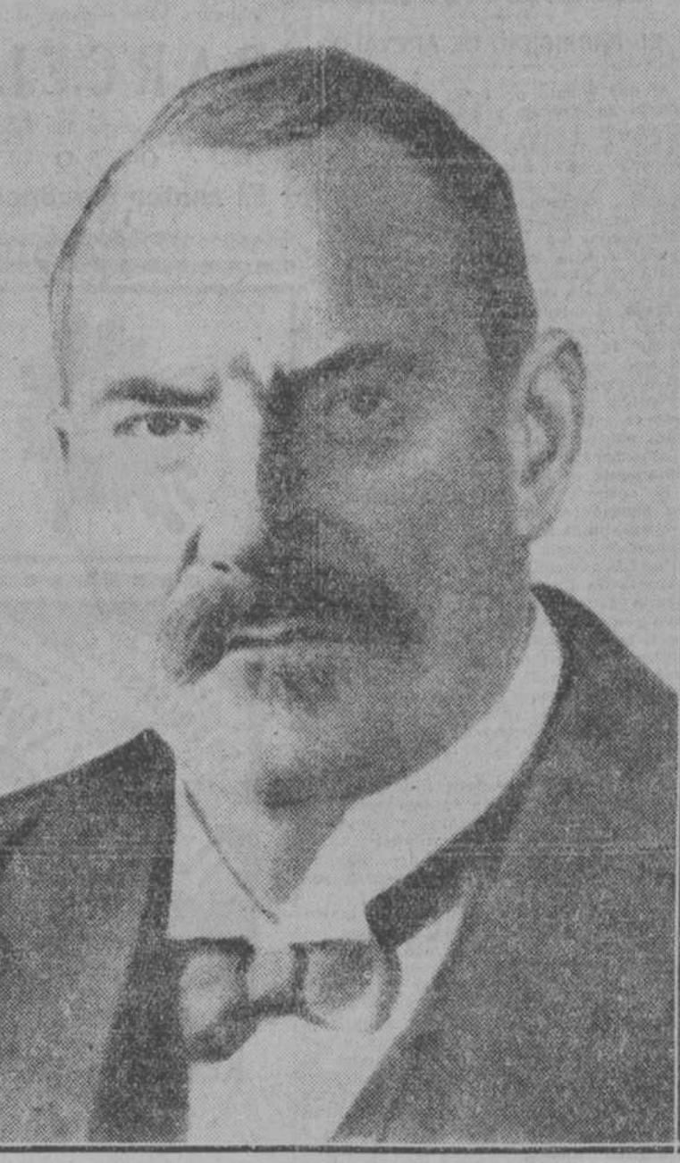
El señor Svinhufvud, Presidente de la República de Finlandia, que ayer cumplió setenta años