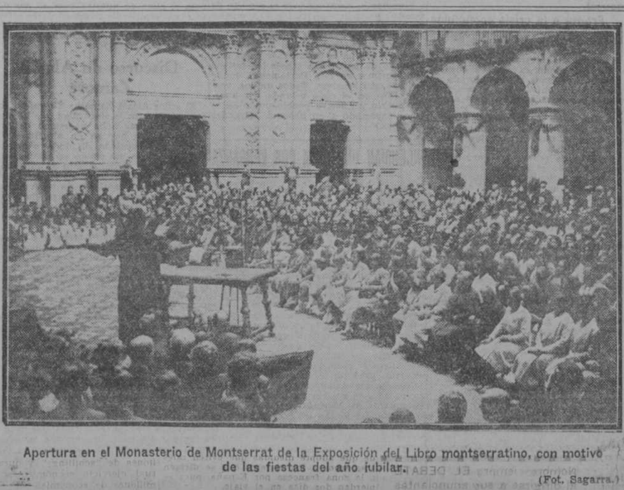
Apertura en el Monasterio de Montserrat de la Exposición del Libro montserratino, con motivo de las fiestas del año jubilar.