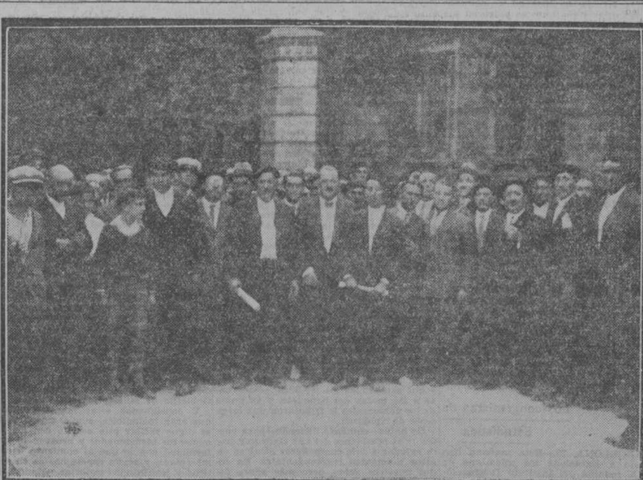
Los alcaldes vascos al salir de la Presidencia, después de la entrega al jefe del Gobierno del Estatuto de Estella.