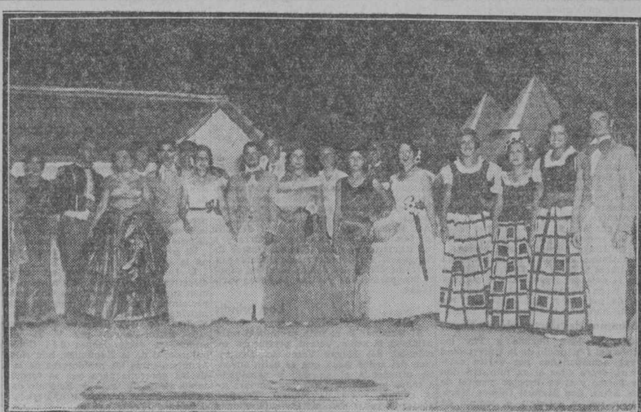
Jóvenes de la colonia veraniega de Vilasar de Mar, que tomaron parte en la revista "Vilasar Revue 1931"