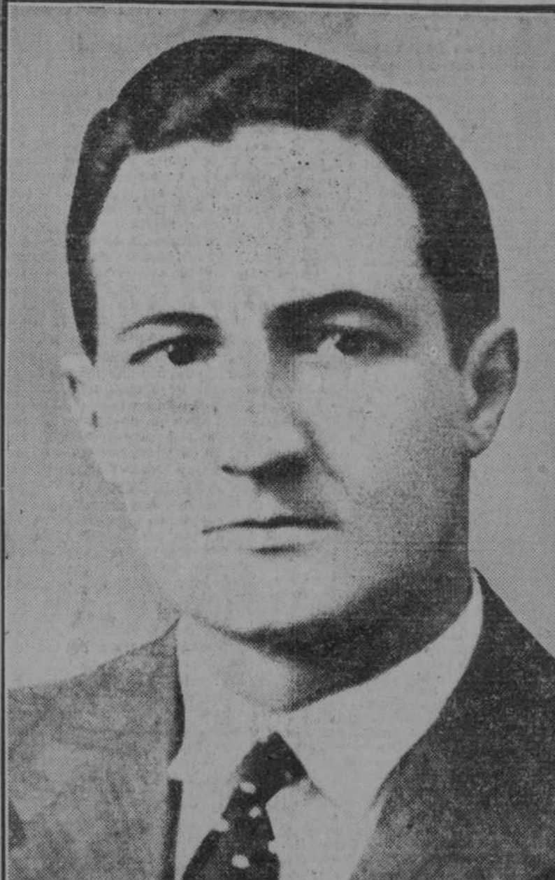
Don José Antonio de Aguirre Lecube, diputado por Navarra, que presentó ayer el Estatuto vasco al jefe del Gobierno

Es injustificada la oposición entre el Estado individual y el corporativo. El Estado corporativo es la mayor y más perfecta organización del Estado individual. La provincia y la región deben tener en cuenta los muchísimos forasteros que no sienten entusiasmos regionales, las abstenciones y los errores de censo. Es tanto como exigir los dos tercios de los electores, el 67 por ciento.