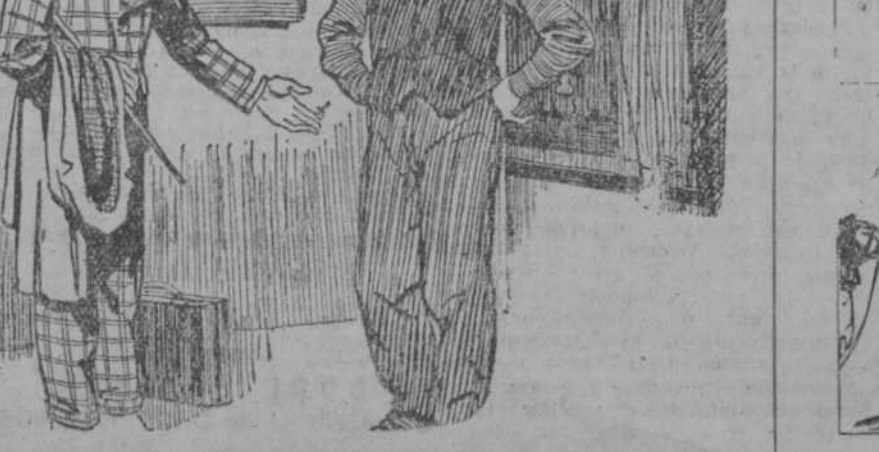
NO ES LO MISMO —He puesto "China" en este cajón para que lo traten con cuidado porque contiene porcelana, y no para que me lo facturen para Changai. ("Everybody's", Londres.)

COLEGIO DONOSO - CORTES Gloria San Bernardo, 5. Incorporado oficialmente a Clases, y dirigido por el presbítero Dr. Nevado. 1.ª enseñanza y bachilleratos. Profesores titulados