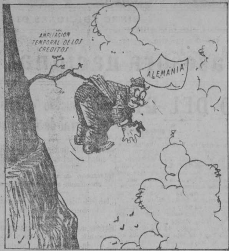
POCO VALE LO HECHO SI EL SALVAMENTO NO SE ORGANIZA PRONTO ("Brooklyn Times").