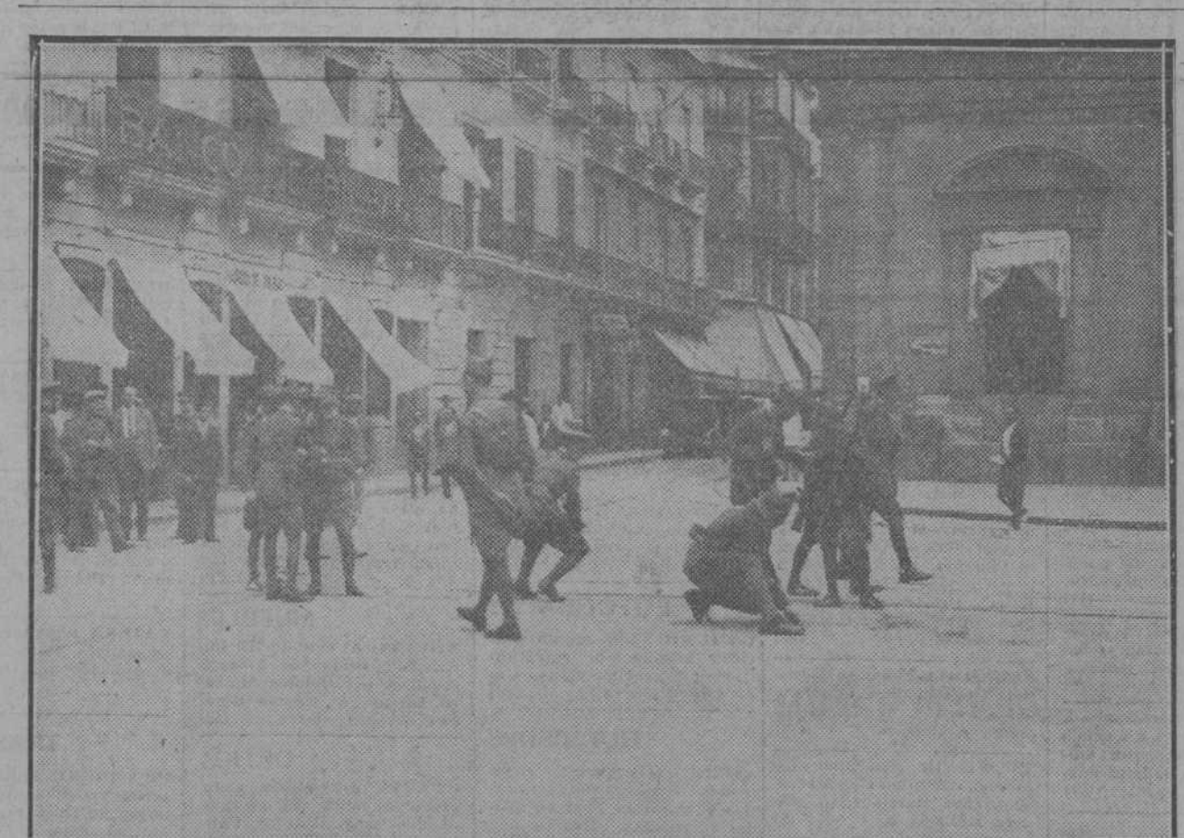
Los militares custodiando la Sucursal del Banco de Bilbao