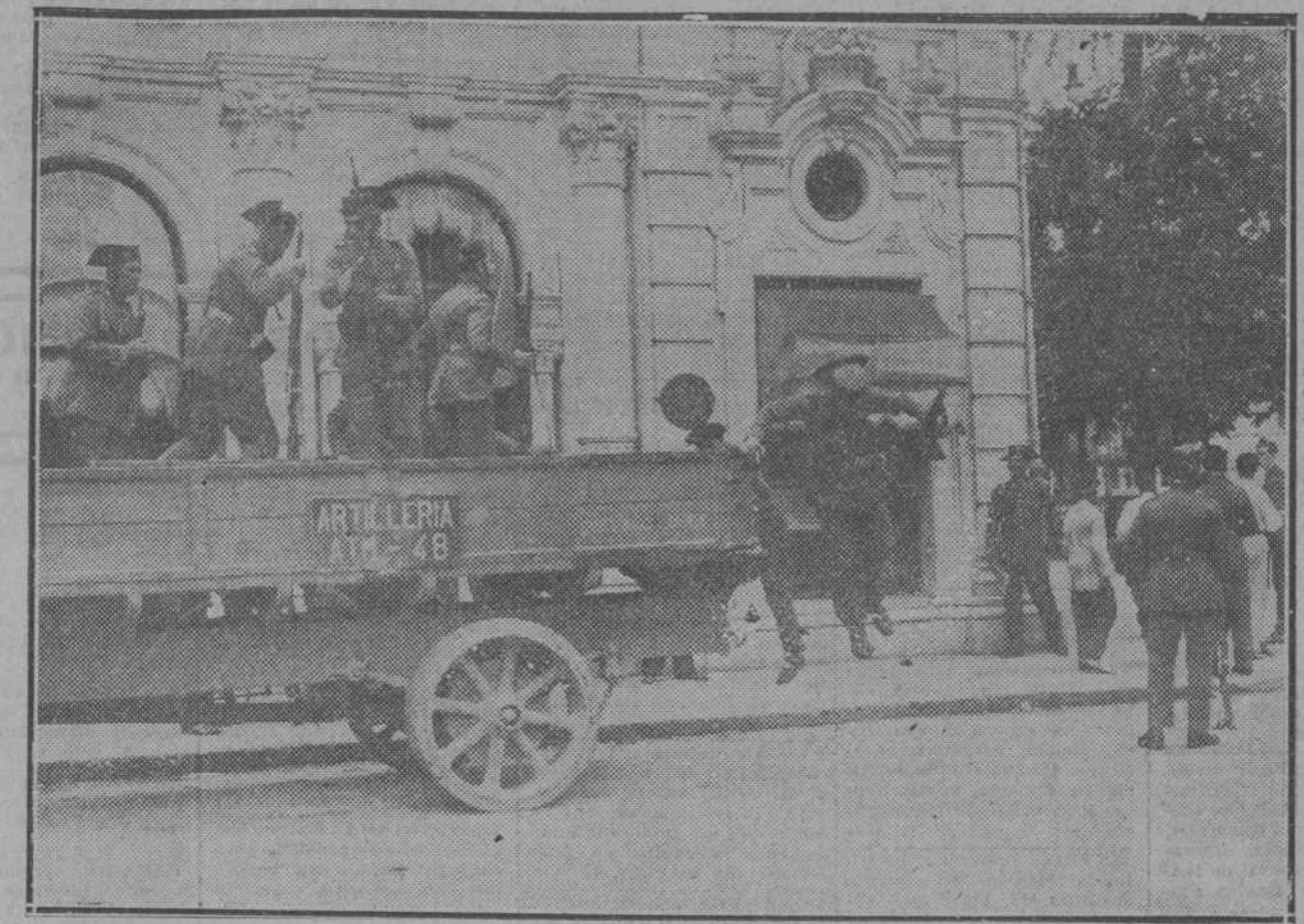
Las fuerzas de la Guardia Civil en el momento de llegar a la plaza de San Fernando, donde se entabló un tiroteo