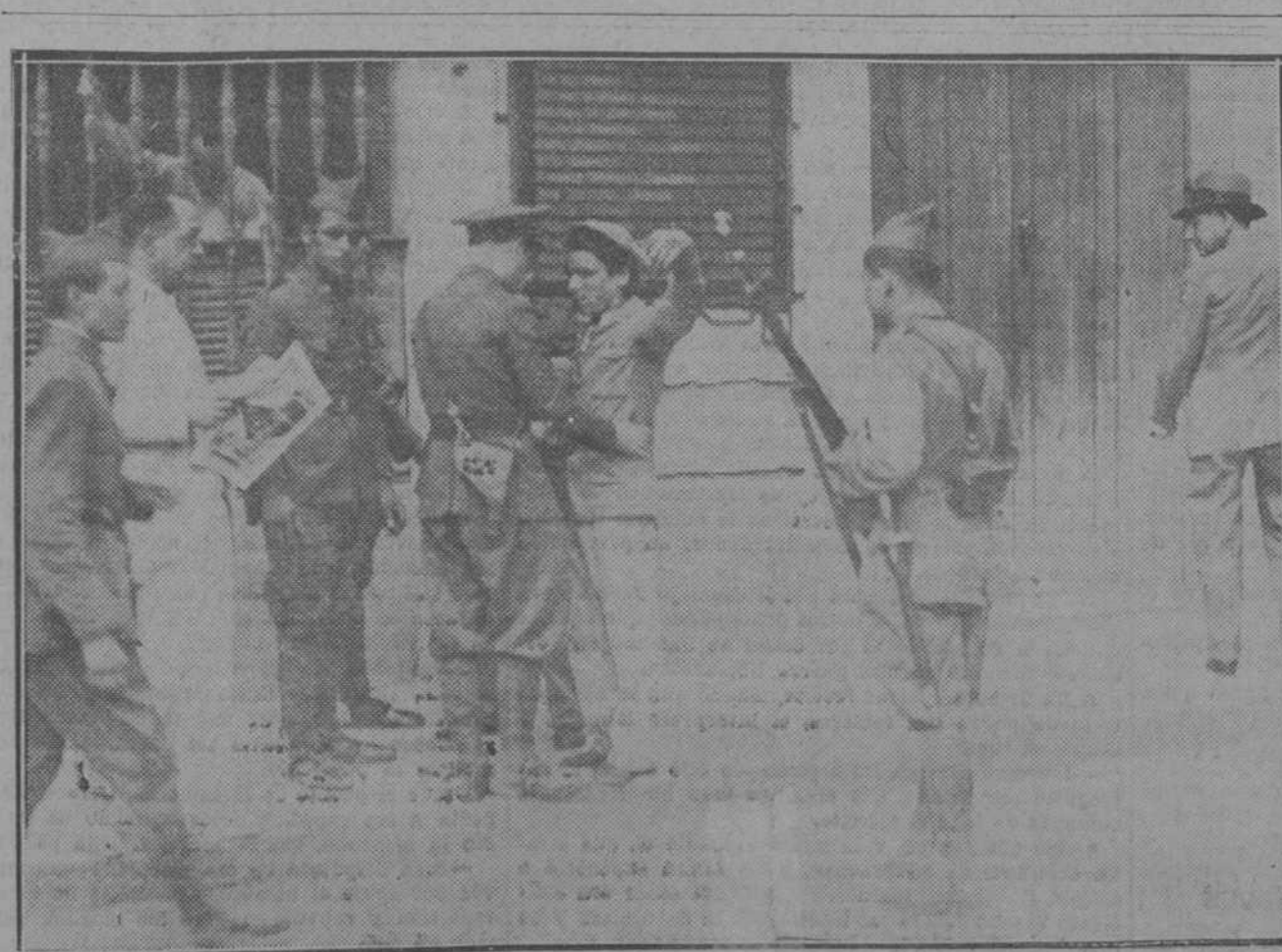
Uno de los innumerables cacheos