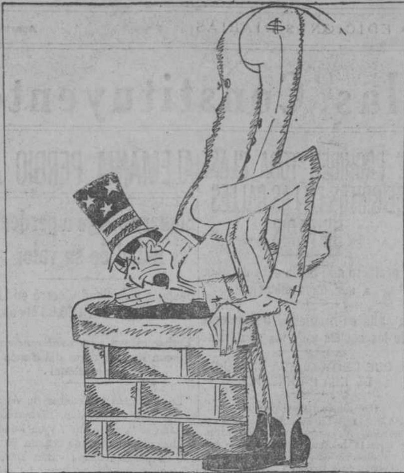
¿ESTAN USTEDES VIVOS TODAVIA? UN MOMENTO, QUE AHORA BAJO