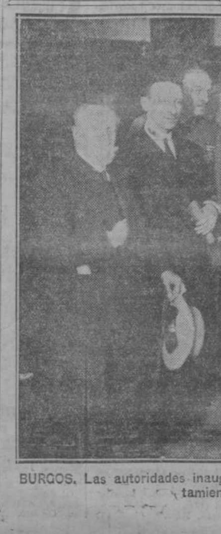
BURGOS. Las autoridades inaugurando la Exposición de Bellas Artes, patrocinada por el Ayuntamiento, a beneficio de los obreros sin trabajo