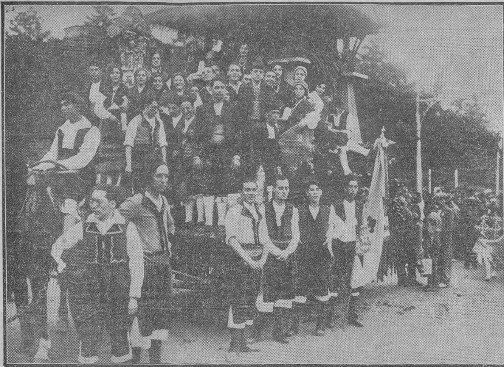
La carroza de Asturias, Galicia, León y Vascongadas. Un hórreo repleto de mazorcas, con la cruz de Durango en primer término