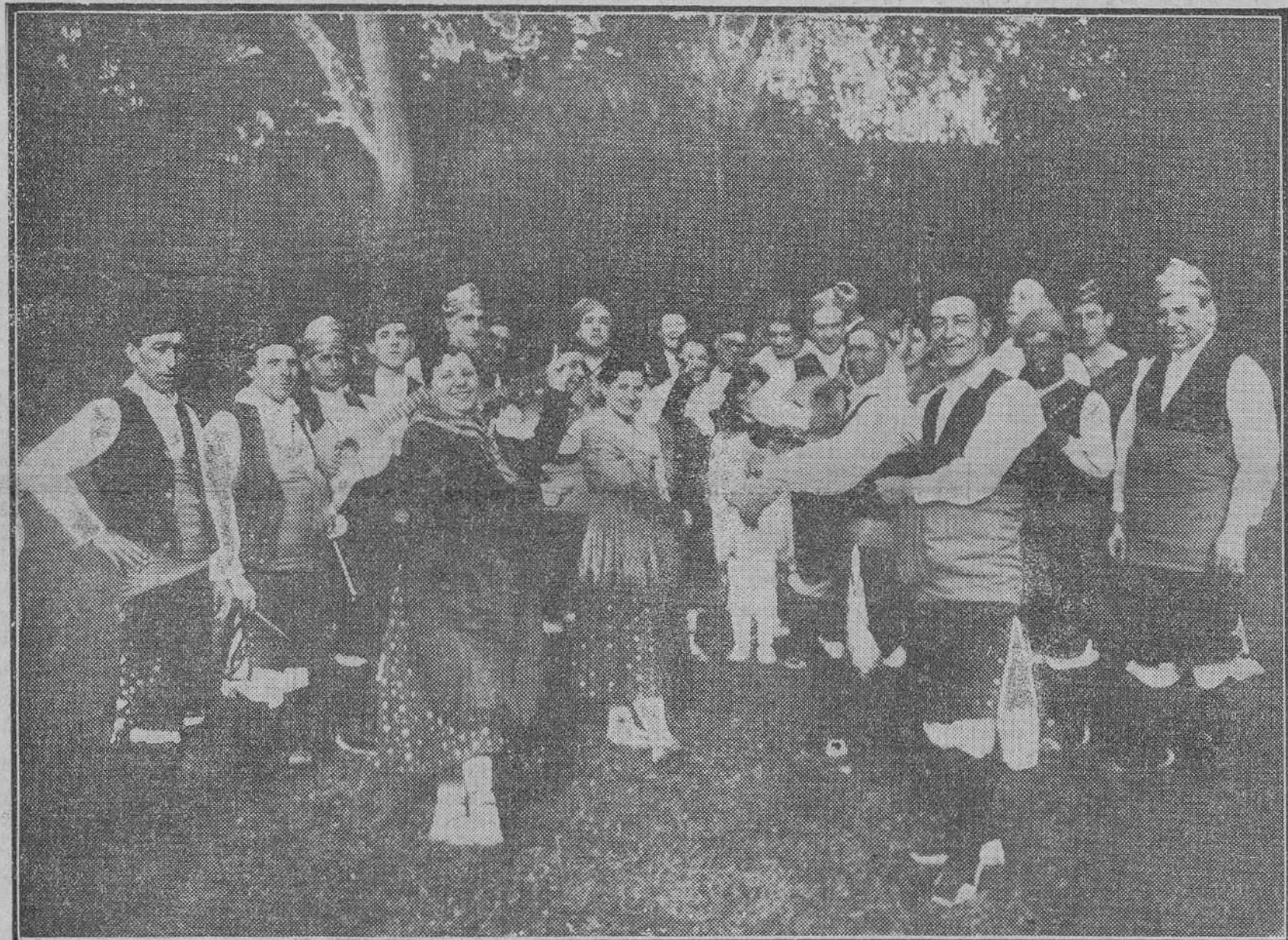
Las rondallas que figuraron en la carroza representativa de Aragón y Navarra, en uno de los altos que hizo la cabalgata regional que ayer desfiló por Madrid