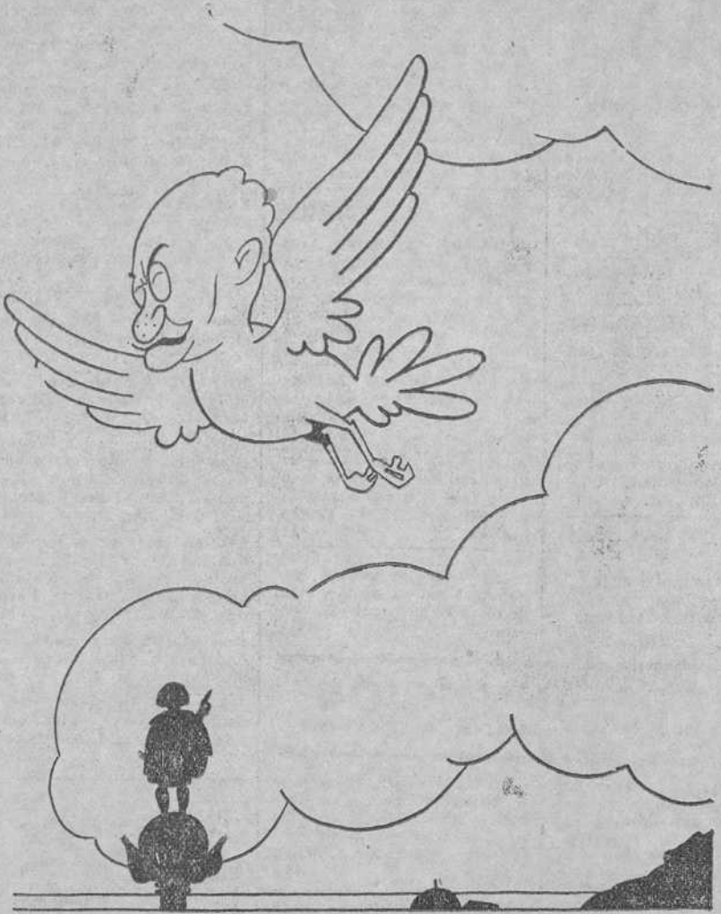
LA PALOMA DE LA PAZ