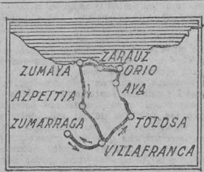
Recorrido de la prueba de Villafranca, puntuable para el campeonato de España

Campeonato guipuzcoano SAN SEBASTIAN, 23.—Reunido el comité ciclista de Villafranca ha acordado celebrar el 2 de agosto una carrera nacional, campeonato guipuzcoano, y