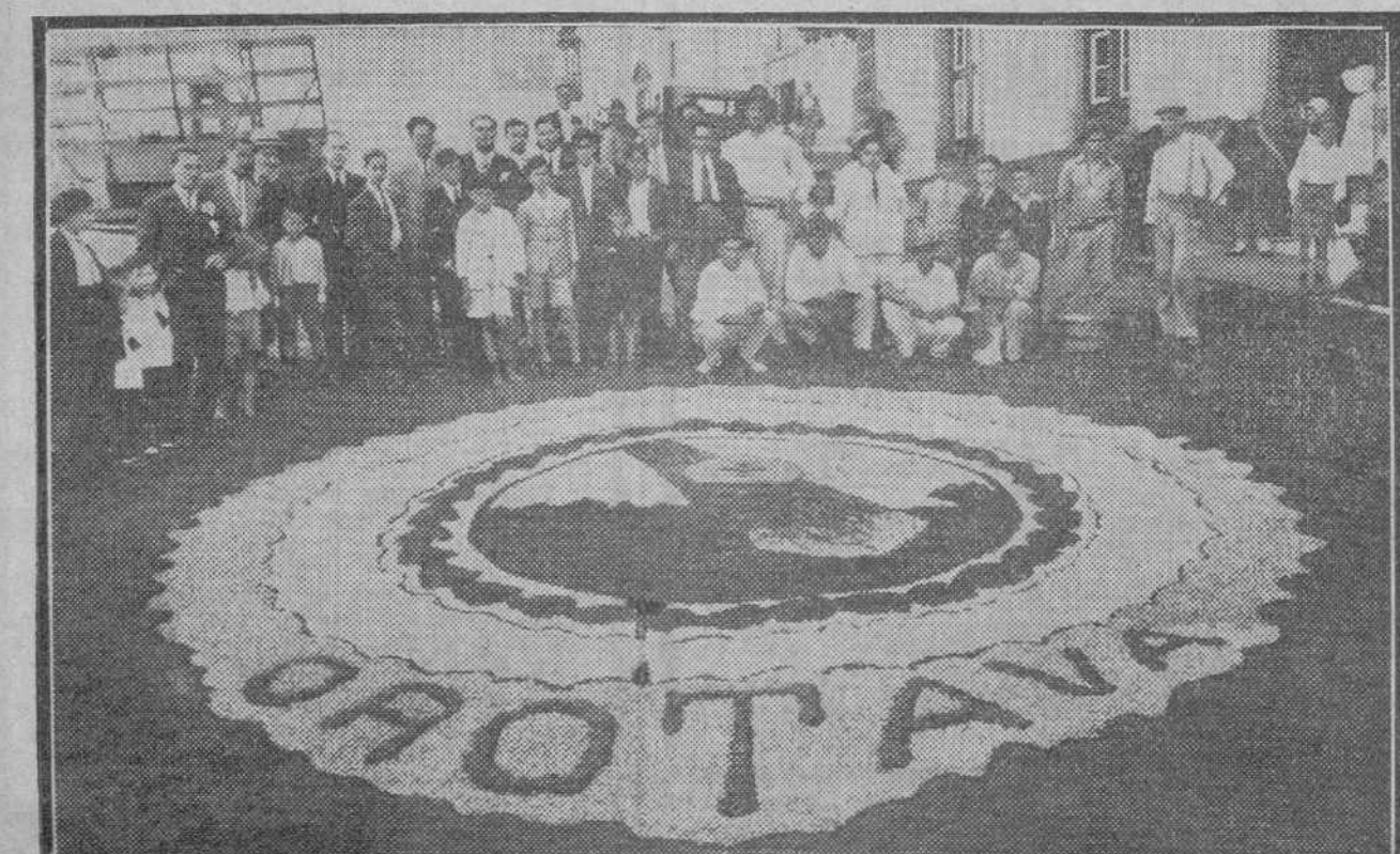
Afombra de flores naturales construida en Orotava (Tenerife), con motivo de la procesión del Corpus

SAINT JOHN (New Brunswick), 23. El incendio que se declaró ayer en los muelles adquirió a última hora enormes proporciones y sólo al cabo de doce horas de trabajos ha podido ser dominado. Tanto los almacenes generales de la "Canadian Pacific", situados a orillas del Saint Laurent, como otros 17 grandes depósitos, el vapor de carbón "Marpaes" y 150 vagones de ferrocarril han sido pasto de las llamas, perdiéndose que las pérdidas pasan de diez millones de dólares. Se teme que, además del hombre muerto, hayan perecido dos toneladas de libros que, para salvar éstos, se metieron valientemente entre las llamas.