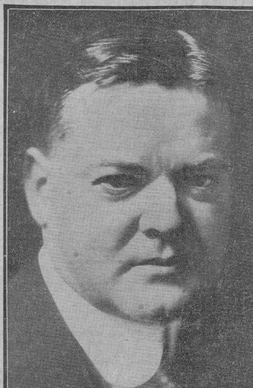
Hoover, presidente de Norteamérica, que ha anunciado la concesión de una moratoria para toda clase de deudas oficiales entre las naciones