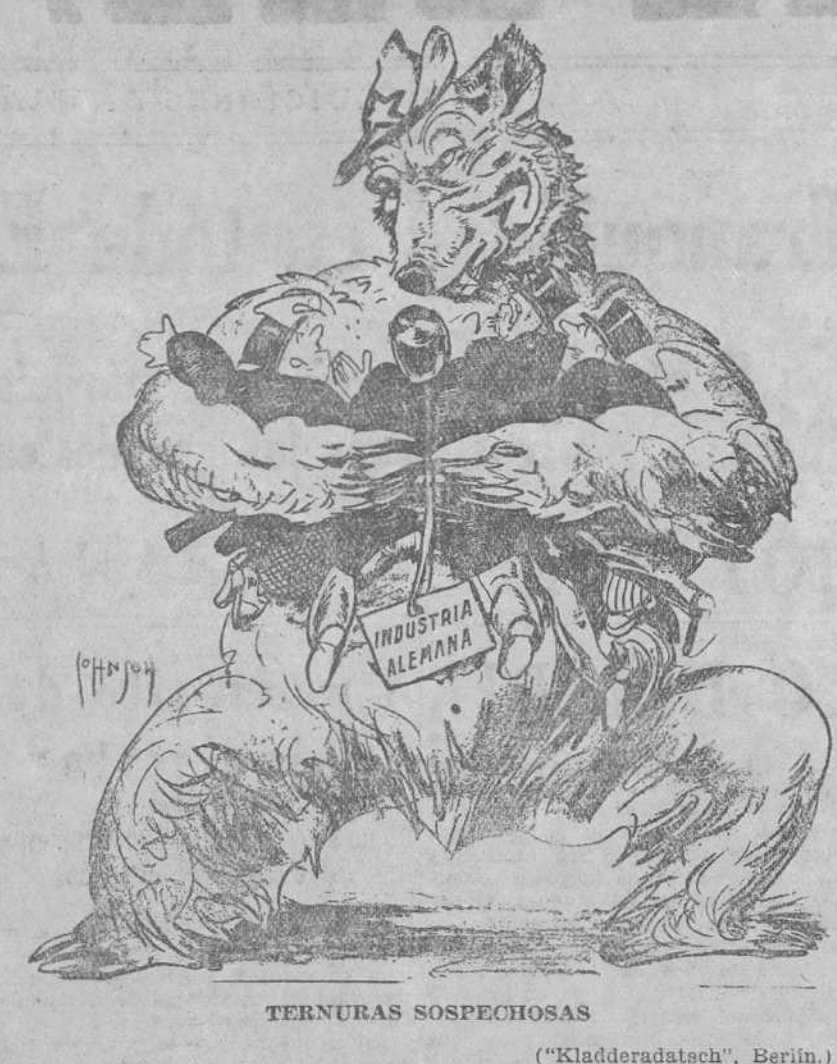
TERNURAS SUSPECHOSAS. ("Kladderatach", Berlín.)