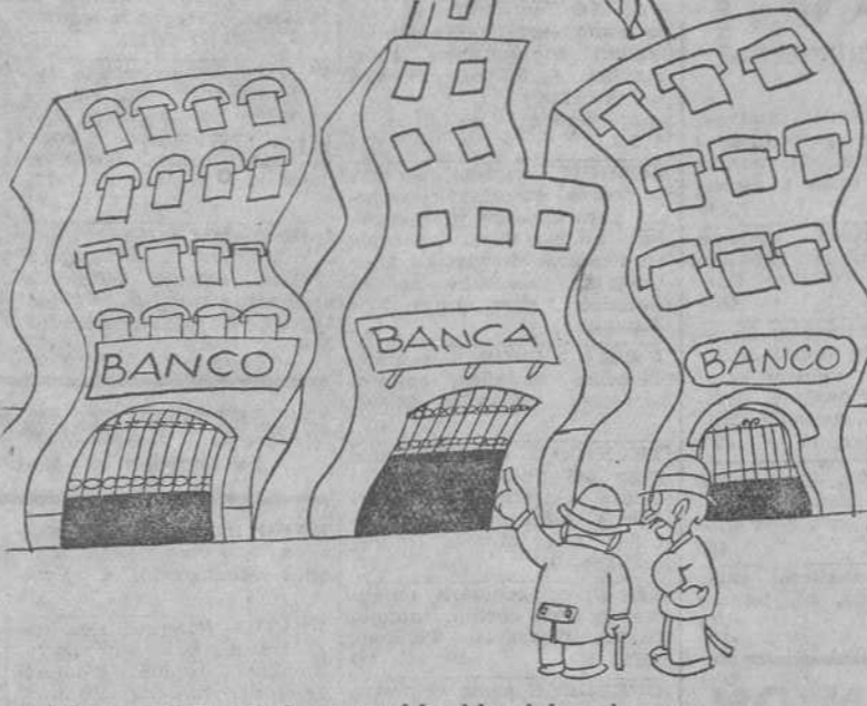
-Fíjese usted. Se ha restablecido el Jurado.