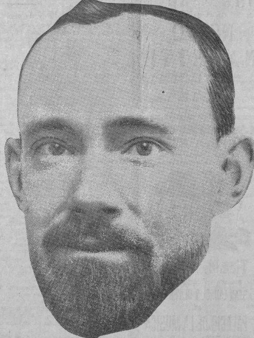
Wilkins, que ha bautizado ayer el submarino en que piensa hacer el viaje al Polo Norte

Ayer fué bautizado por un nieto de Julio Verne el "Nautilus", nombre del submarino en que el explorador Wilkins piensa realizar un viaje al Polo Norte. Para Wilkins, que en 1926 voló sobre el Polo Arctico y en 1928 descubrió seis islas en el Polo Sur y en 1930, en el mismo Polo, encontró nuevas tierras antárticas, un viaje más a las regiones polares no podía constituir una novedad. Por esto concibió el proyecto de llegar bajo el agua hasta donde llegó por el aire. Y transformó un submarino viejo que le regaló el Gobierno yanqui en el "Nautilus", nombre de leyenda que tan bien cuadra a la hazaña que proyecta el inquieto explorador Wilkins.