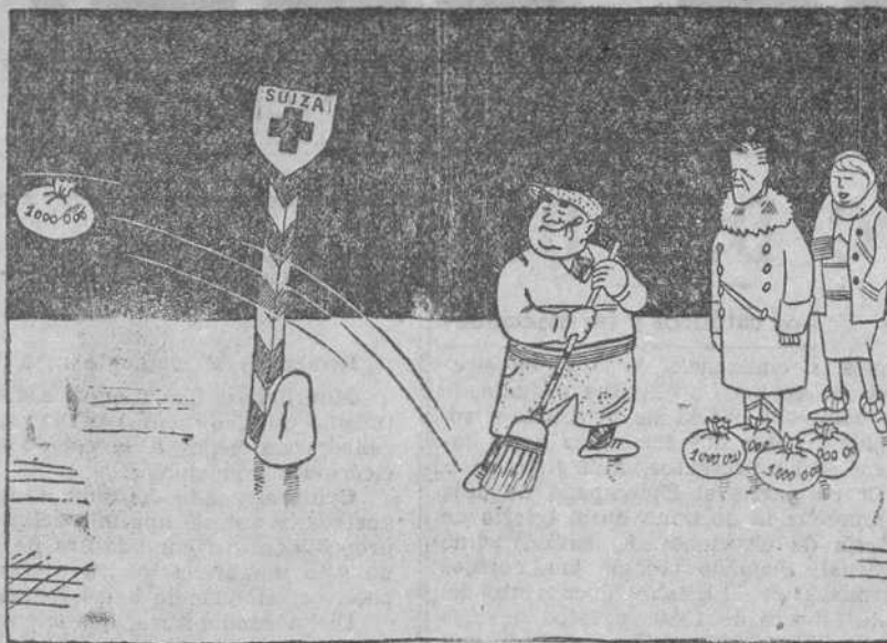
DEPORTES DE INVIERNO EN LA FRONTERA SUIZA