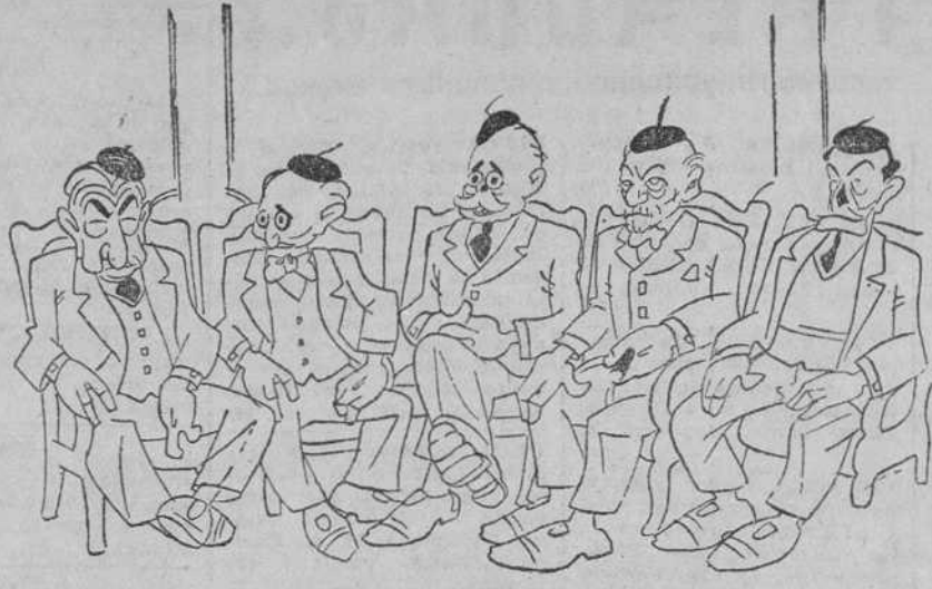
Grupo de supervivientes del naufragio del pesquero "Vieja Política", que se fué a pique el 13 de septiembre de 1923.