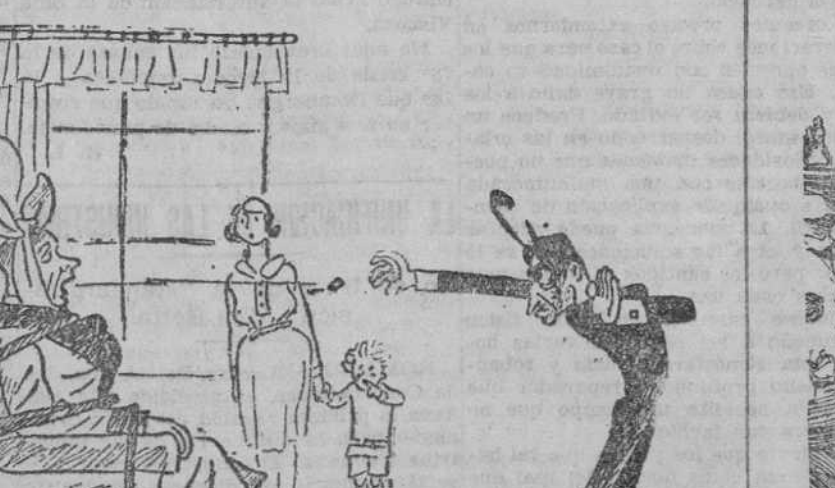
El hipnotizador sacando una muela en virtud del poder de atracción del magnetismo. ("Der Wahre Jakob", Berlin)