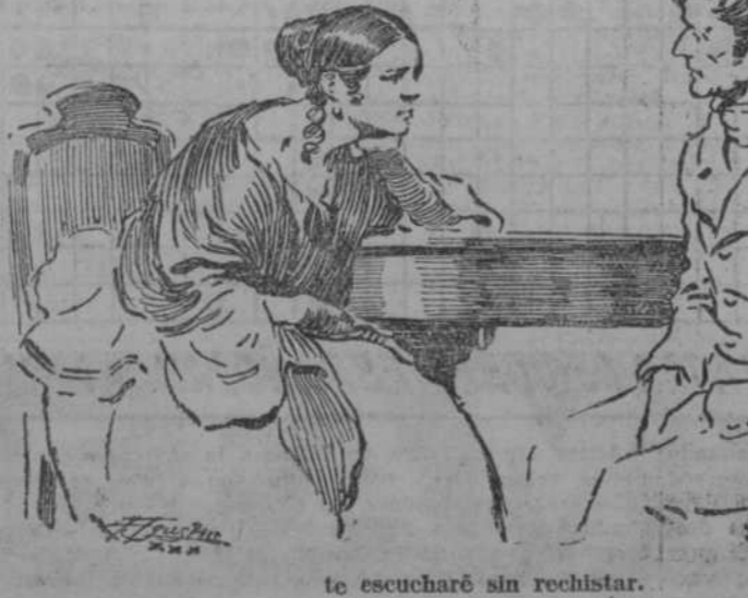
te escucharé sin rechistar.

a que has llegado, la pobreza, por no decir la miseria en que vivías. Don Alonso salió de la estancia, y luego de elegir con la dueña del hotel la habitación que había de ocupar Heliona y de dar órdenes para su decorado y amueblamiento, encargó que avisaran a una costurera y a una modista para que al día siguiente por la mañana se entrevistaran con su hija, que les daría instrucciones.