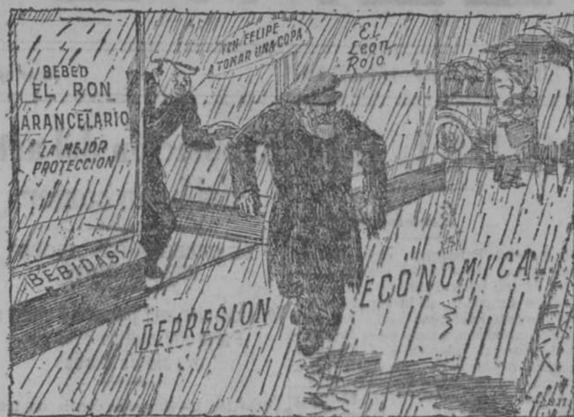
SNOWDEN.—No, gracias. Aunque no sé qué voy a hacer si este tiempo continúa. ("Glasgow Evening Times")