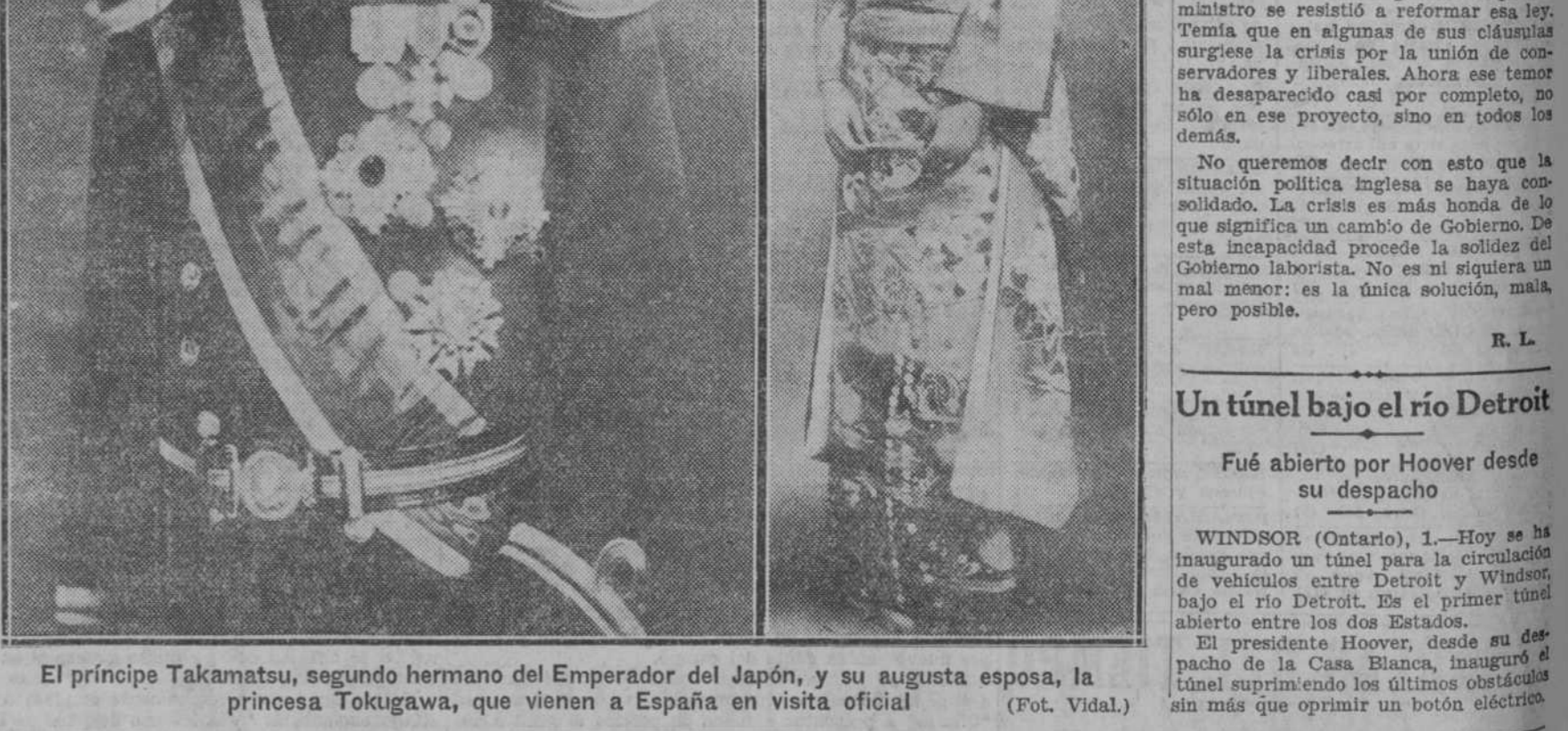
El príncipe Takamatsu, segundo hermano del Emperador del Japón, y su augusta esposa, la princesa Tokugawa, que vienen a España en visita oficial

Fué abierto por Hoover desde su despacho WINDSOR (Ontario), 1.—Hoy se ha inaugurado un túnel para la circulación de vehículos entre Detroit y Windsor, bajo el río Detroit.