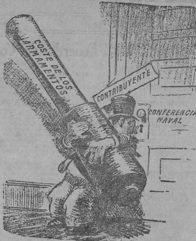
EL ESPECTADOR INTERESADO