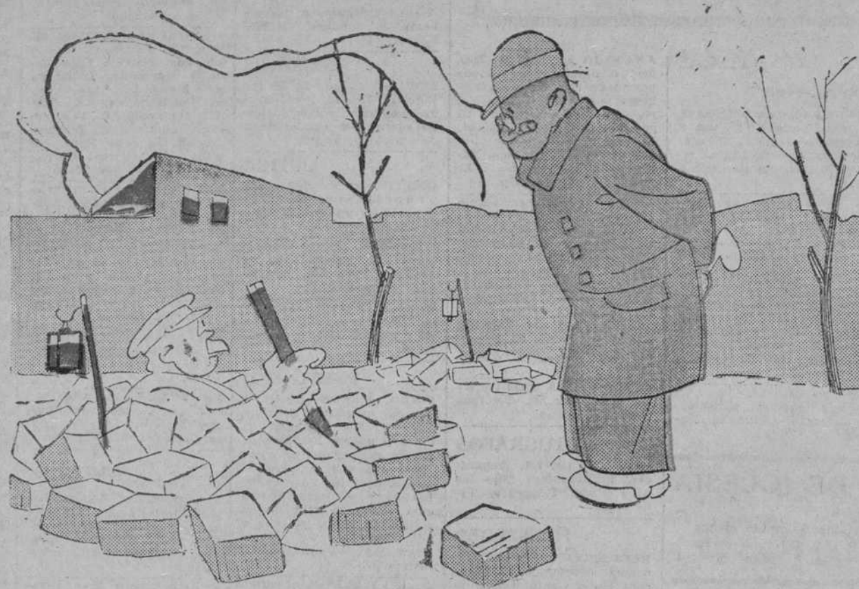
EL MEDICO DISTRAIDO.—Pierden ustedes el tiempo lamentablemente. Lo que le conviene al subsuelo es pasar una temporada en la Sierra.