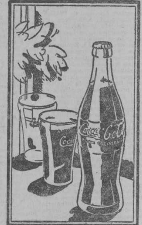
En esta bebida encontrará usted un sabor nuevo y diferente a todos los conocidos

ANTES de probarla, las personas expertas en el conocimiento de bebidas exóticas creían imposible que hubiese una — compuesta sólo de frutas — cuyo gusto sedujese por exquisito y desconocido. Coca-Cola, la bebida de fama mundial — ahora de venta aquí — vino a convencerlos de lo contrario. Actualmente el éxito de Coca-Cola va extendiéndose por toda Europa... En los casinos, clubs, cafés y bares, el público toma — durante cualquier época del año — esta exquisita y espumosa bebida. En el mundo entero se consumen cada día ocho millones de botellas. Los productos de catorce frutas distintas — expertamente mezcladas en su composición — son el origen de las cualidades vigorizantes que caracterizan Coca-Cola. Pruébela usted hoy mismo. Le entusiasmará.