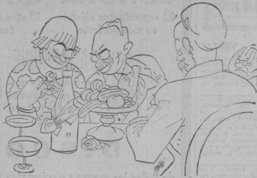
—El encuentro a usted, Ambrosia, más joven y bella que nunca. —Calle, calle; que se me sube el pavo.