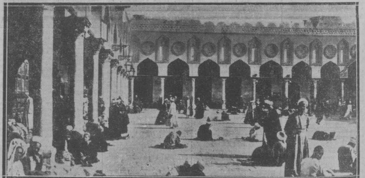
La mezquita de Azhar en el Cairo, donde radica la famosa Universidad