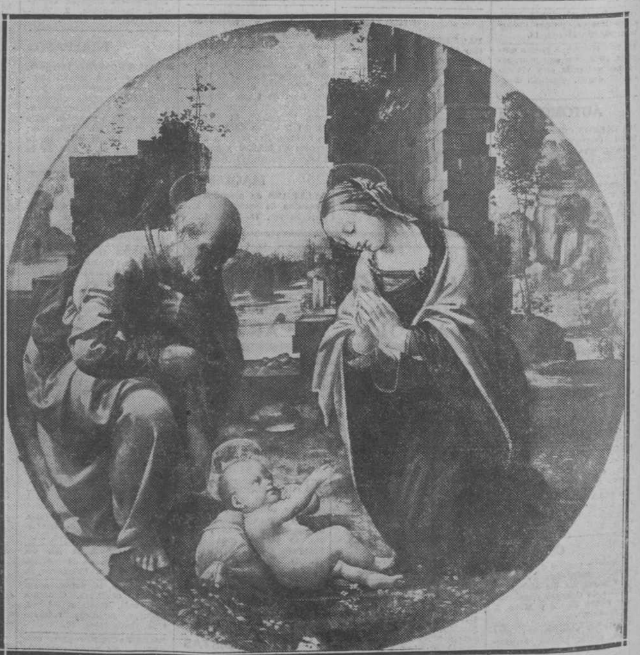
La Adoración del Niño Jesús, por Lorenzo di Credi, una de las joyas pictóricas más valiosas de la Galleria Borghese de Roma.