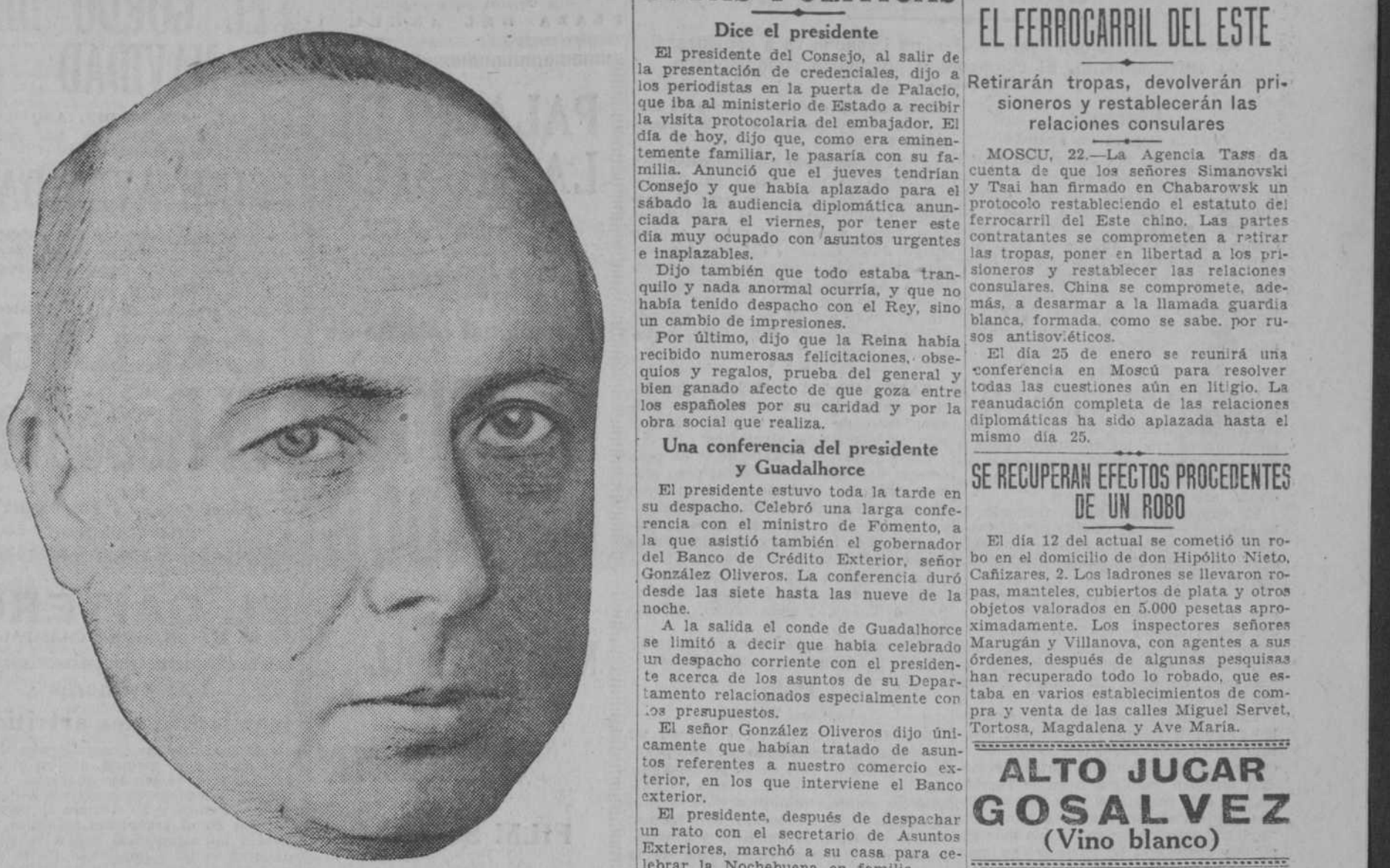
El profesor Moldenhauer, nuevo ministro de Hacienda alemán