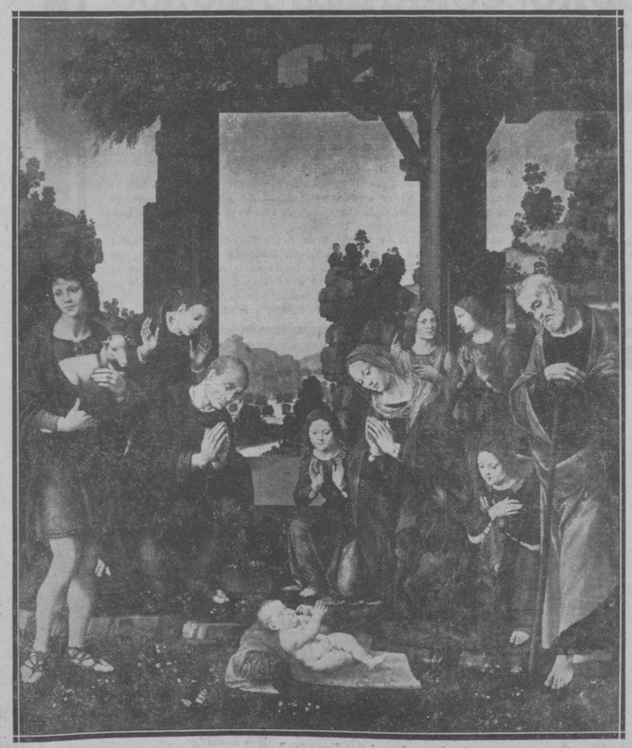
La Adoración de los Pastores, cuadro de Lorenzo di Credi, que se conserva en Florencia en la Galleria Uffizi

Nosotros hemos actuado en la creencia de que no se podía llegar a un acuerdo duradero, a menos que ese fuera aceptado por el pueblo egipcio, y de ahí que hayamos suprimido del tratado todas las restricciones que podían causar irritación. Por lo demás, creemos que no habrá nadie capaz de aconsejar una política de fuerza en los momentos presentes, y el Gobierno cree que las disposiciones del presente tratado servirán para iniciar una época más cordial entre Inglaterra y el pueblo egipcio.