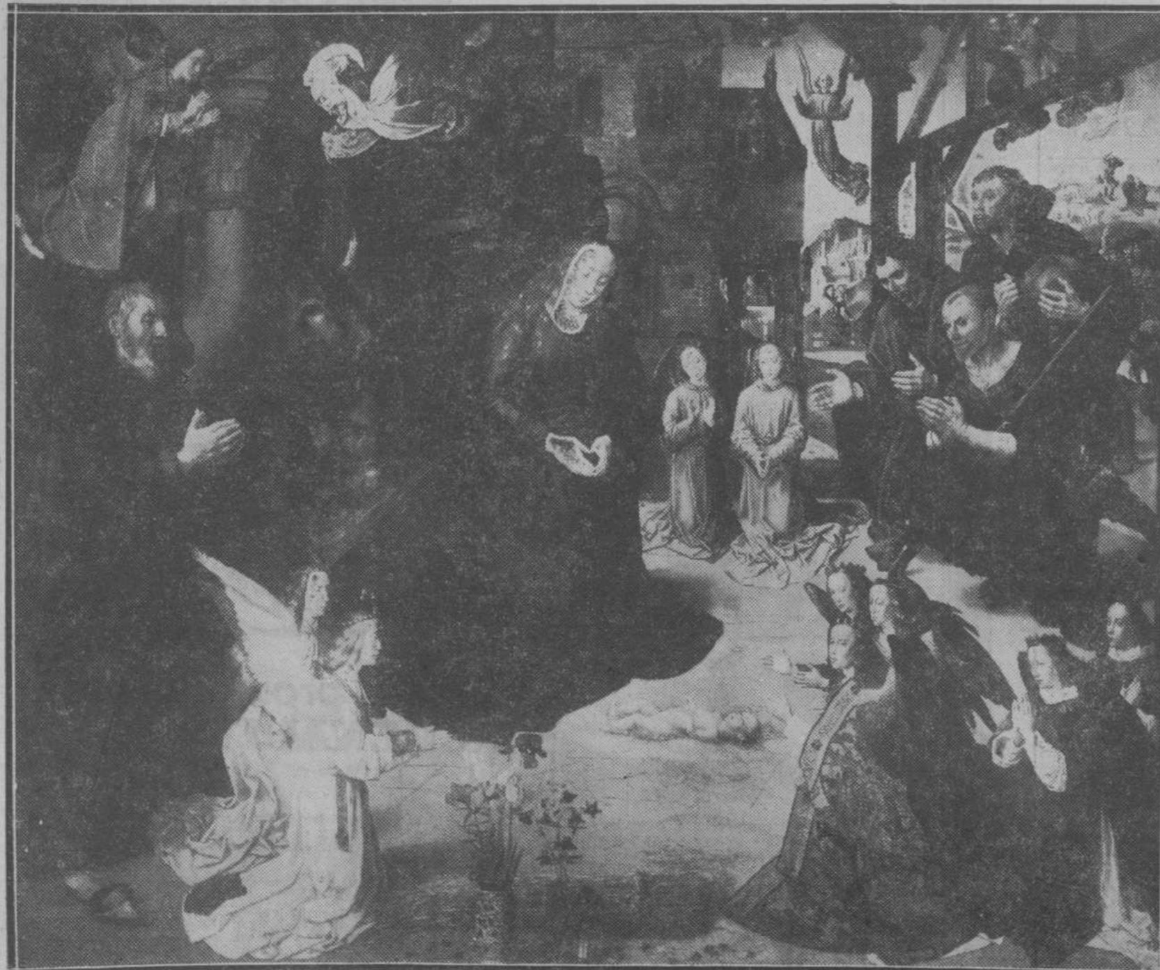
El Nacimiento de Jesucristo, originalísima pintura de Ugo Van der Goes, de la Galleria Uffizi de Florencia.