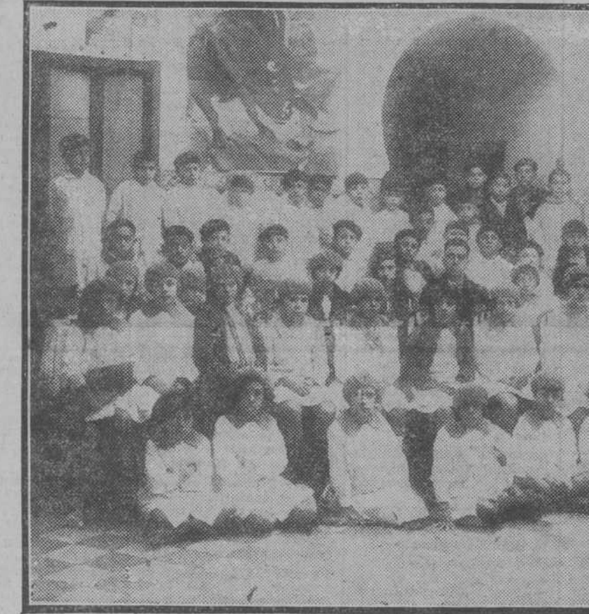
Los sesenta niños de las Escuelas Nacionales de Córdoba, que forman la Colonia Escolar de Altura, al salir, acompañados de sus profesores, para el Cerro Muriano, donde permanecerán hasta fines del mes de diciembre.