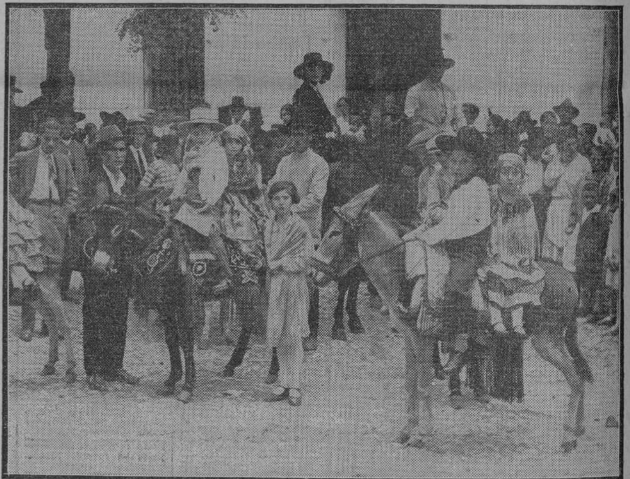
SEVILLA.—Grupo de niños que obtuvieron premio en la romería de Cazalla.