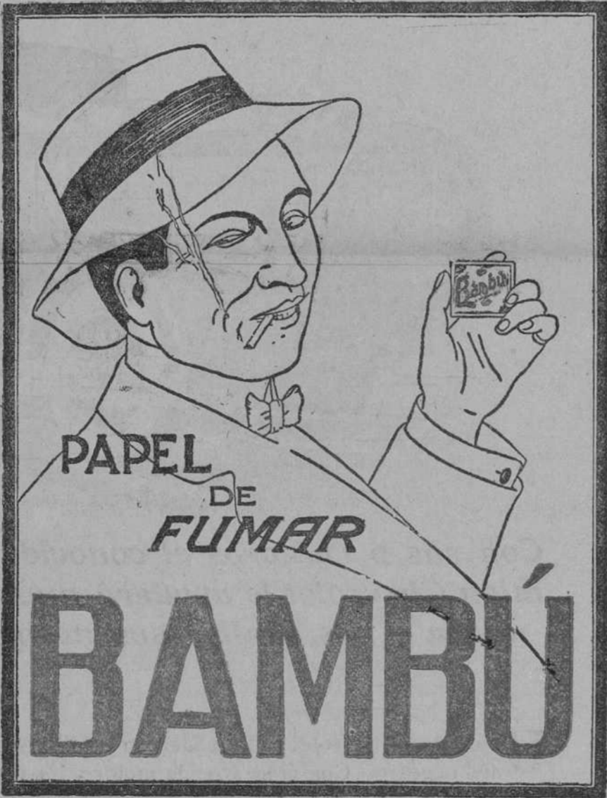
SUCURSAL EN MADRID Fuencarral, 147