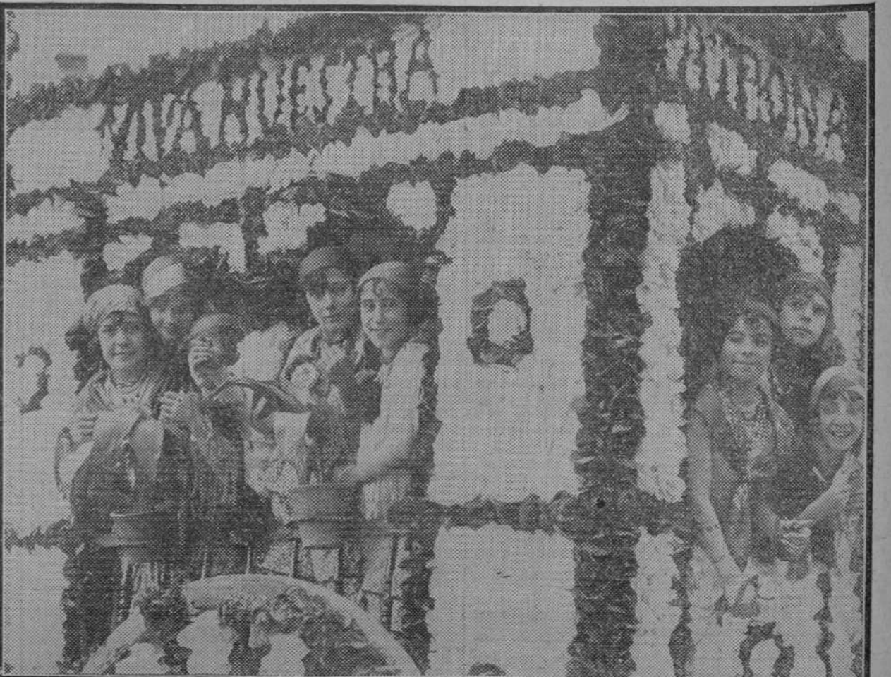
SEVILLA.—"El mejor balcón", carroza que fué premiada en la romería que se celebró en Sierra Morena en honor de la Virgen del Monte, Patrona de Cazalla.