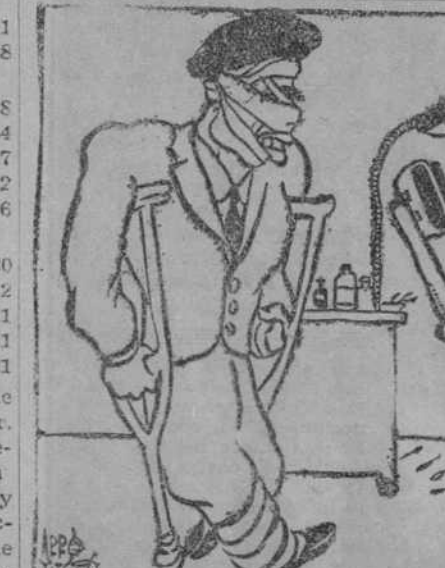
DESPUES DE LA PELEA