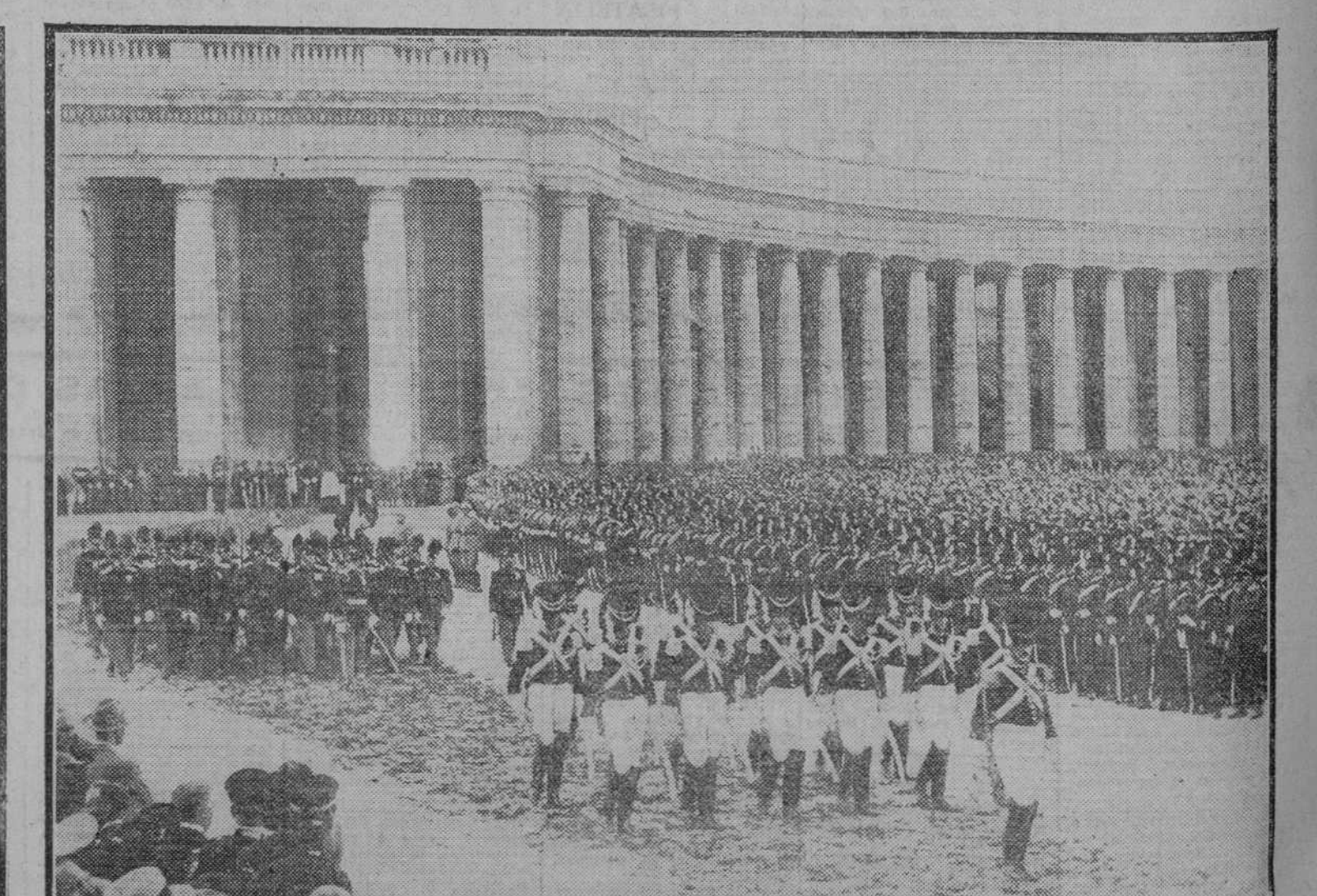
En la fotografía de la derecha se ven dos piquetes de la Guardia Noble y de la Gendarmería pontificia. La fotografía de la izquierda es el paso de un grupo de seminaristas, formados en filas de seis.