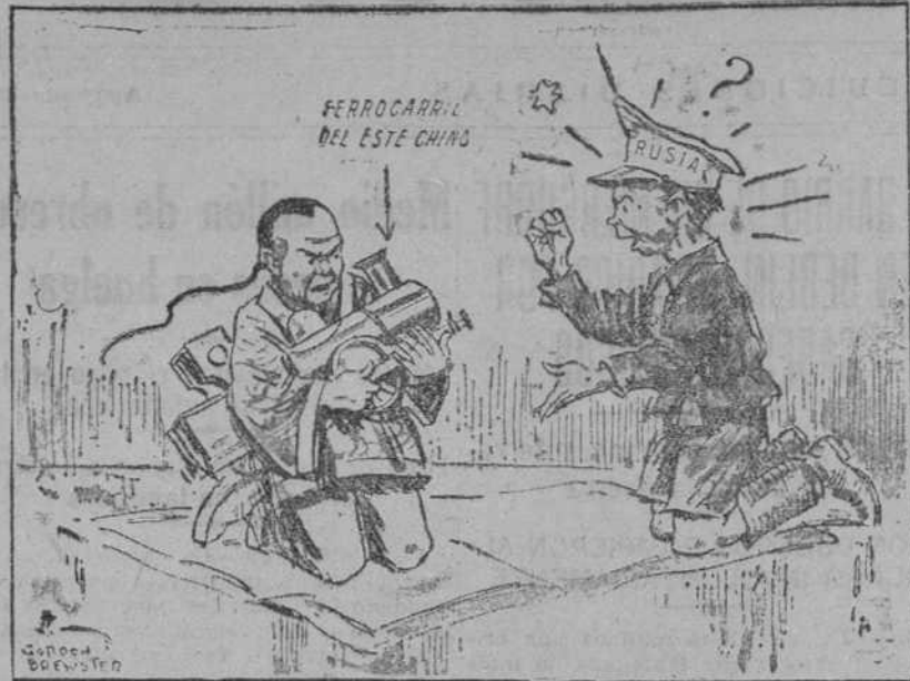
EL CONFLICTO CHINORRUSO