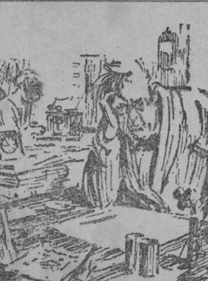
LOS LADRONES ANTE EL CONFORT MODERNO

—Aquí hacen una crítica de tu última obra. EL AUTOR FECUNDO.—Sí. El crítico dice que es la segunda vez que la escribo. Y ahora que pienso en ello, me parece que tiene razón!