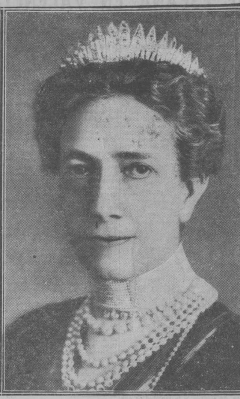
La reina Victoria de Suecia, que se halla enferma de gravedad

La augusta señora reside en la capital de Italia desde hace tiempo. Su salud venía inspirando inquietudes, que ahora, por desgracia, parecen acentuarse. El rey Gustavo salió hace días para Roma, y se halla al lado de la enferma. La reina Victoria nació el 7 de agosto de 1862, y cuenta, por tanto, en la actualidad sesenta y seis años. Nació princesa de Baden y se casó en 1881, en Callsruhe.