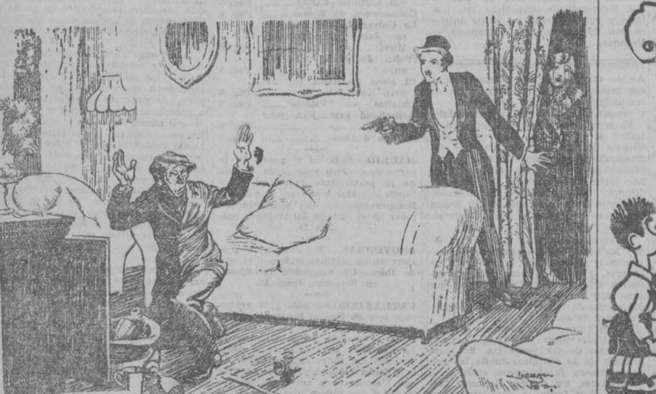
EL LADRON (sorprendido por el matrimonio que regresa del teatro).—Estos tranochadores han sido siempre la maldición de la sociedad.

CHAMPAGNE VEUVE CLICQUOT PONSARDIN REIMS Fiel a su tradición secular, esta Casa sirve siempre los deliciosos vinos de sus afamados viñedos de la Champagne.