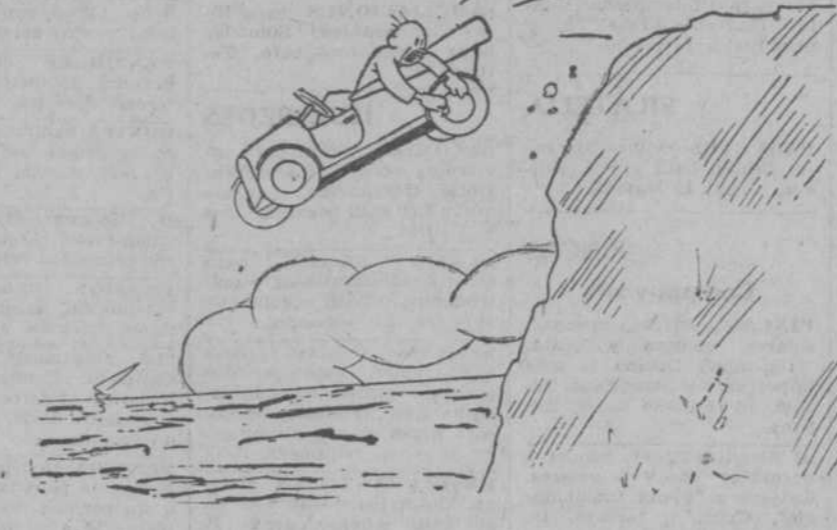
¡Pronto! ¡Un salvavidas!