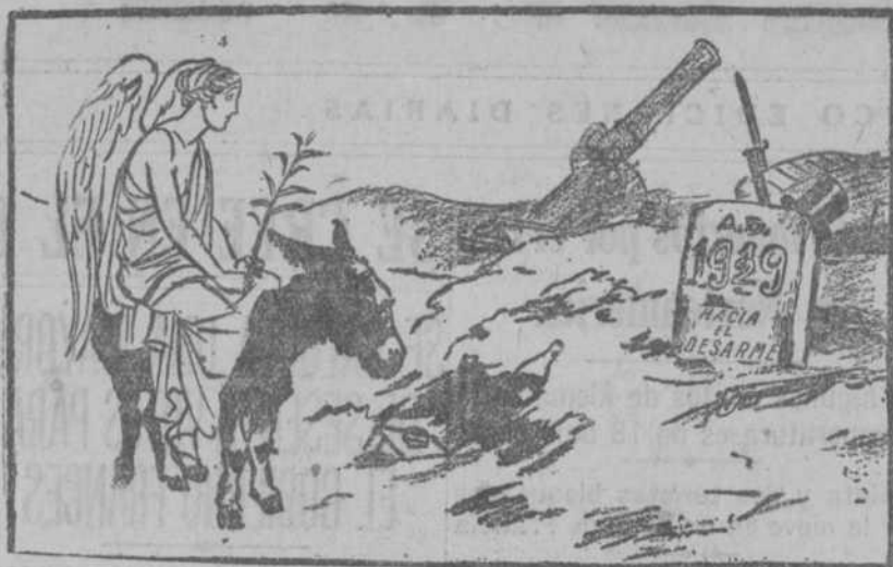
LA PAZ.—Este punto es igual al de donde salimos el año pasado.