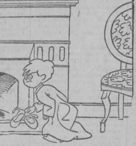
—¡Chist!... A lo mejor vuelven en seguida; ahora los Reyes viajan mucho de incógnito.