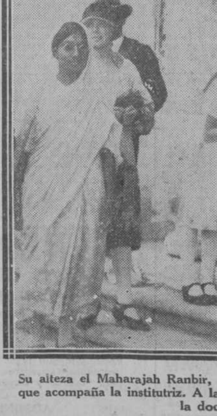
Su alteza el Maharajah Ranbir, de Jind (1) con su esposa, la Maharain (2), y sus seis hijos, a los que acompaña la institutriz. A la izquierda, la doncella de la Princesa, con el traje del país, y detrás, la doctora inglesa que cuida de los excursionistas.