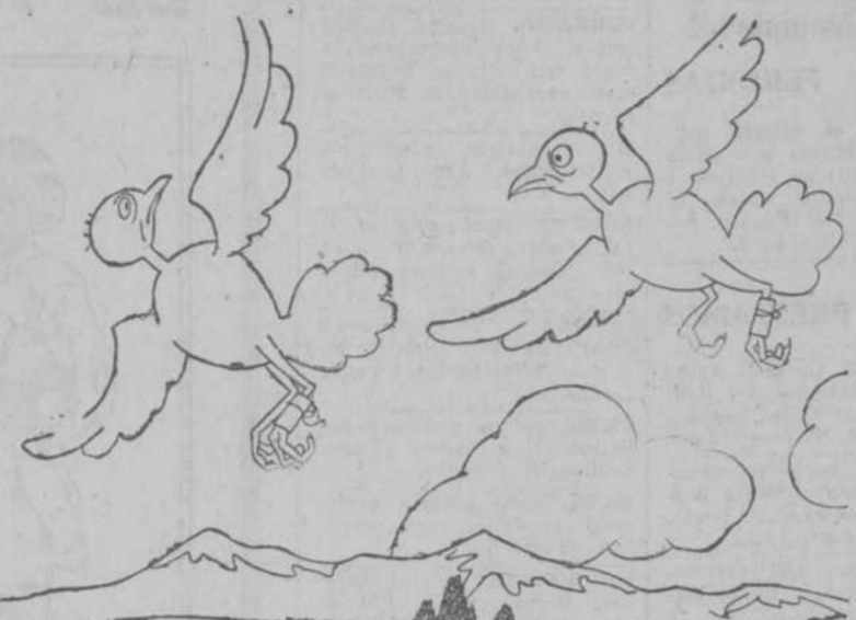
—Chica, llevo un dolor de barriga que no veo. —Baja; avería en el motor.