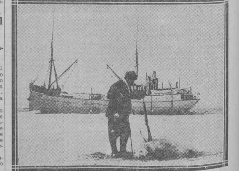
El barco "Hobby" donde hicieron la expedición los condes de Ribadavia, y que ahora lleva socorros al general Nobile. En primer término aparece el conde de Ribadavia, examinando un oso muerto por él.

Los condes de Ribadavia y el zaribaban en español, con gran contento de todos.