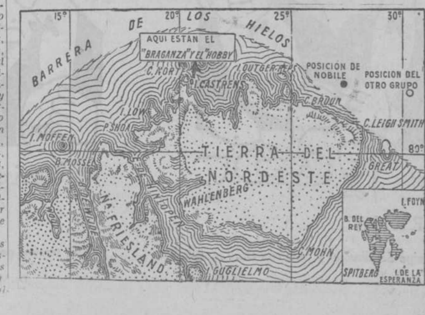
Map showing the location of King's Bay and Spitzberg in the Arctic region.

Fué el debelador de la revolución y el apologista formidable de las grandes instituciones sobre que se asientan el orden y la sociedad actual. Cantó como pocas la monarquía, la familia, la propiedad, el ejército, las órdenes religiosas y, sobre todo, la Religión, la Iglesia y la Patria. Con fragmentos de sus artículos, de sus discursos y libros a