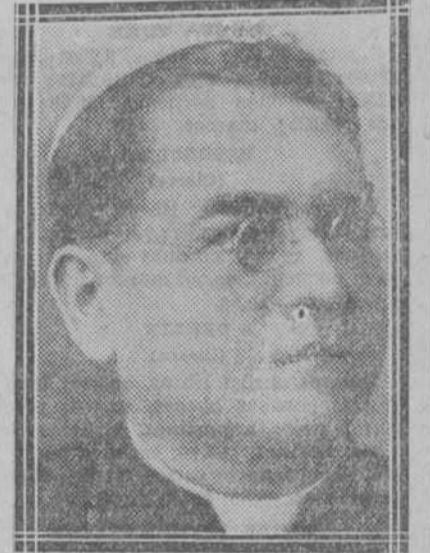
El Obispo de Guayana