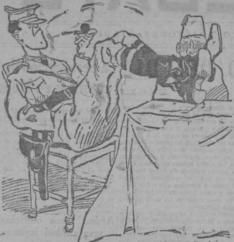
—La negociación ha sido cordial.