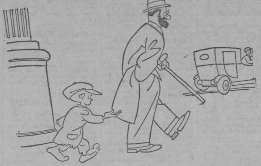
—Señorito, deme usted una perra chica, que no es para mí, que es para tirarla en los desmontes de Cea Bermúdez.