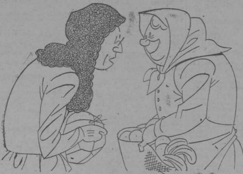
—Bueno, pero ¿qué es eso de fotografías milimétricas? —Son unas que entran mil en la media docena.