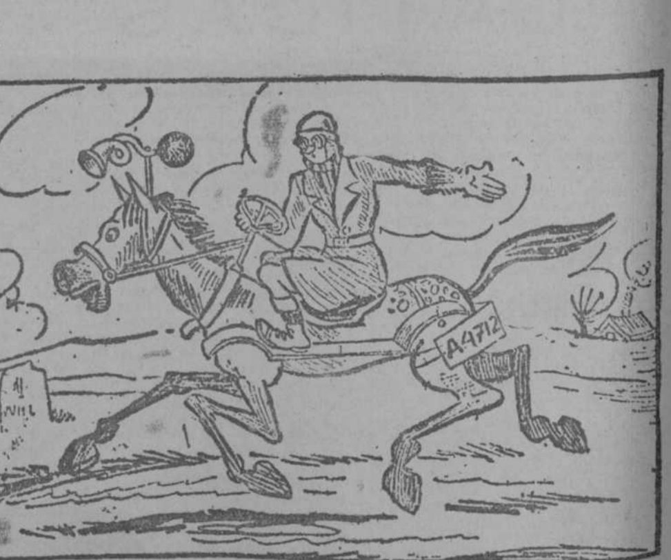
Un automovilista pertinaz se ve obligado a montar a caballo.