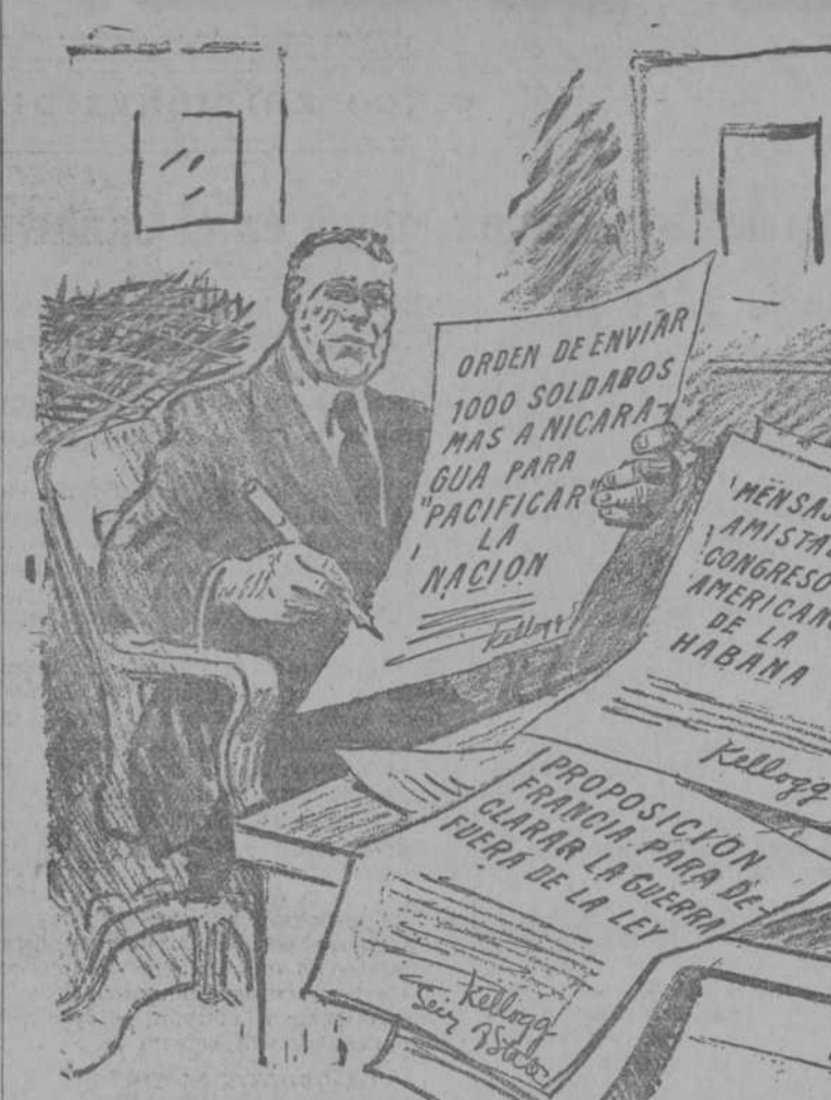
La hora de la firma en la Secretaría de Estado yanqui