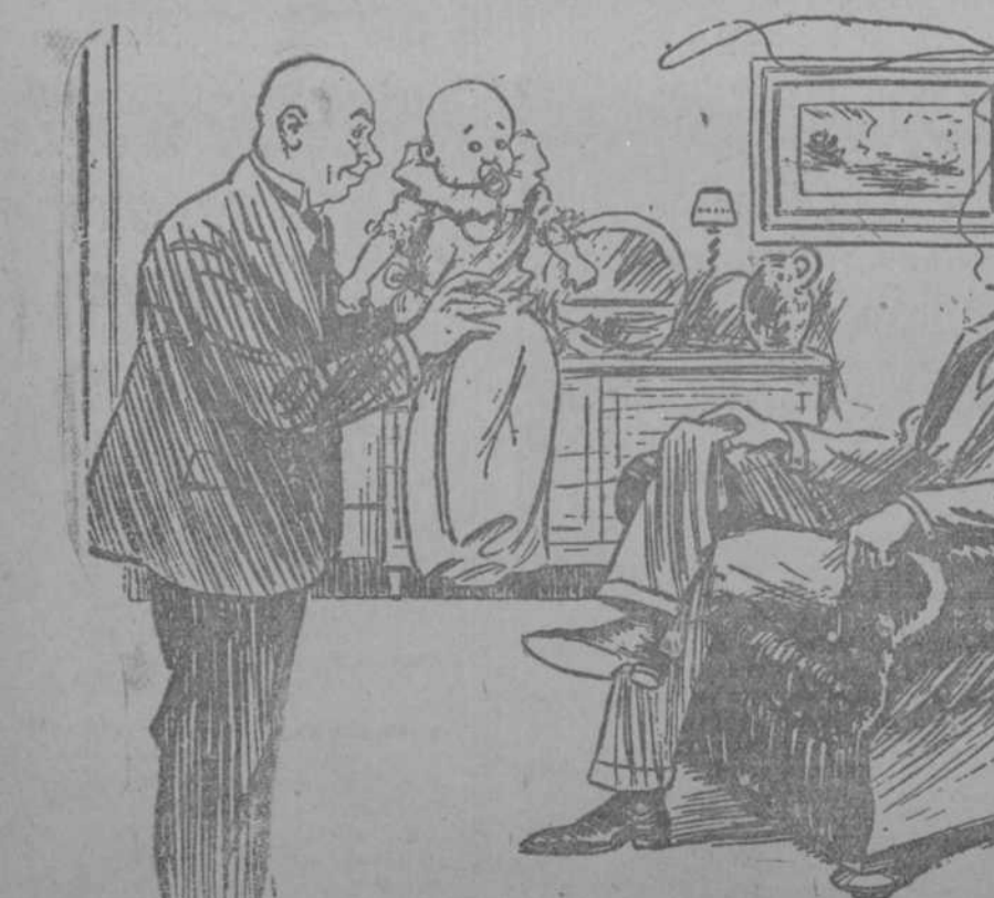
EL PADRE.—¿No crees que se parece a mí? EL AMIGO.—Mucho. Tenéis el mismo pelo.

LIMOGES, 7.—Una anciana de setenta y cinco años, que falló repentinamente en la carretera, llevaba en los bolsillos, al morir, 23.000 francos, de los cuales 7.000 eran lises.