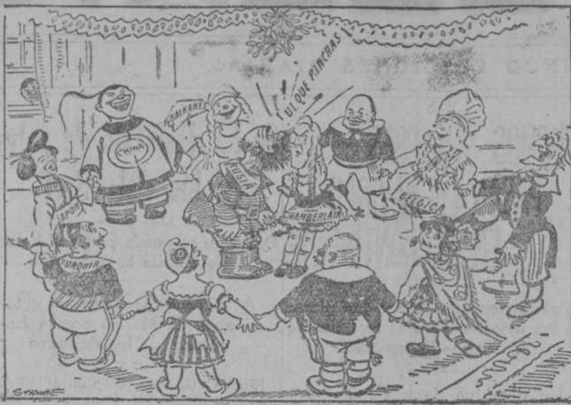
UN BESO EN EL CORRO