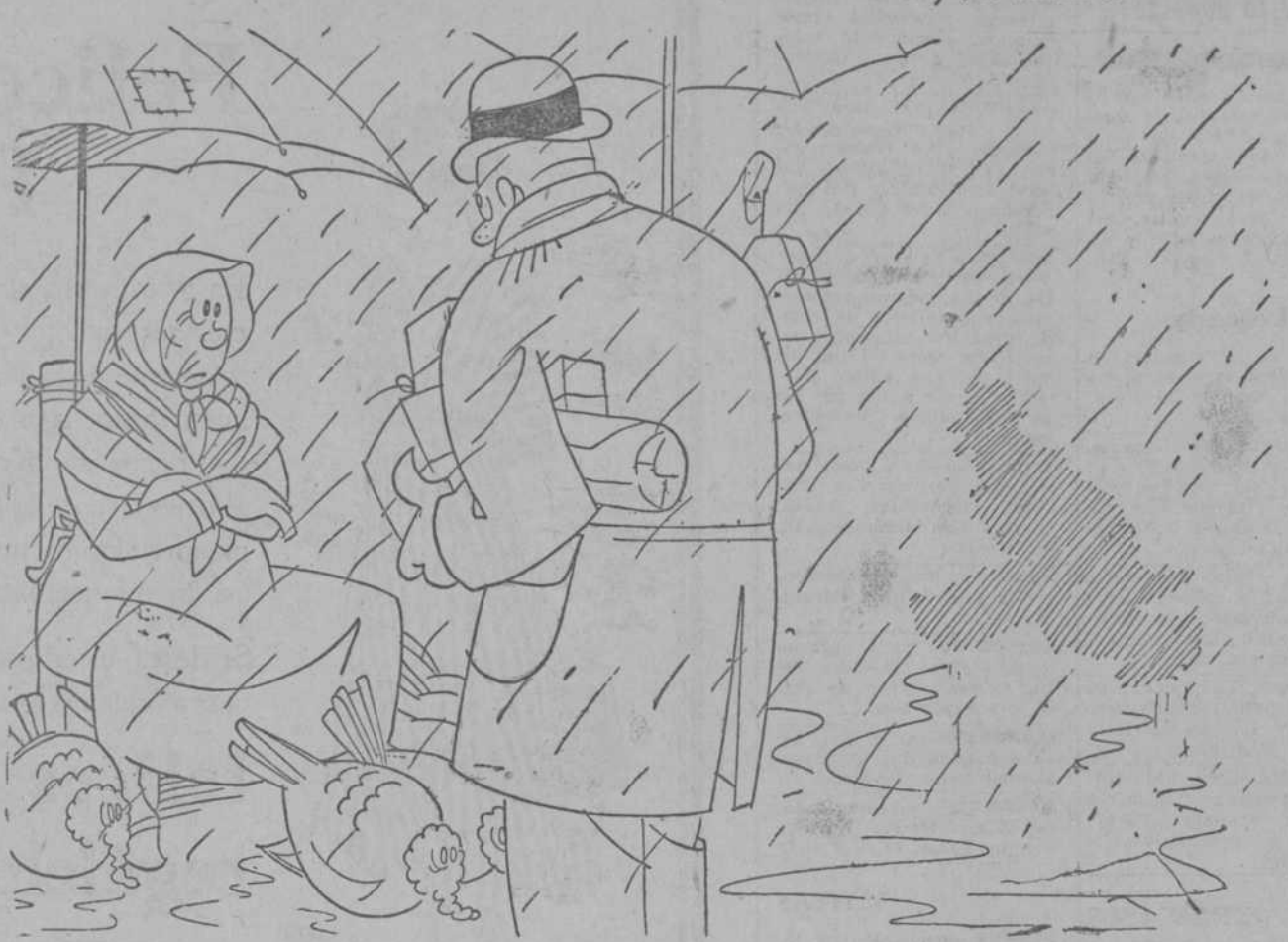
—¿Qué desea el señor? —Un pato, porque vivo lejos.