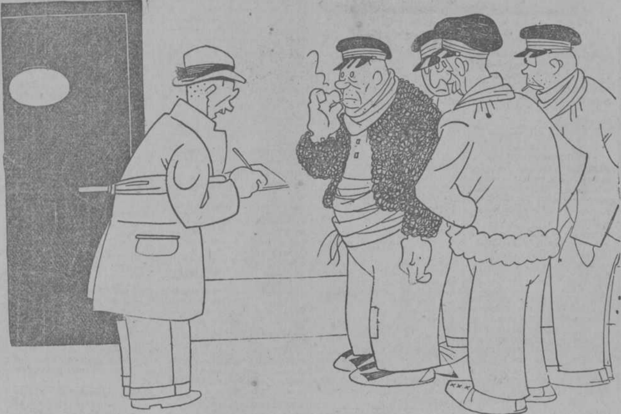
—¿Y no les asustan a ustedes los pasos que tendrán que dar? —¡Je, je! ¡Si aquí, el que más y el que menos, se "hace" cuarenta kilómetros diarios por su buena peseteja!