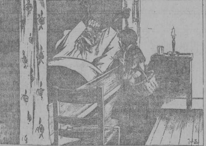
CAPERUCITA ROJA.—Abuelita, qué manos más largas tienes. EL LOBO.—Para abrazarte mejor.