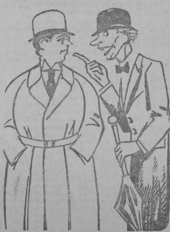
—Usted es un imbécil! Se lo dice uno que sabe lo que es eso. —Ciertamente; se le conoce en la cara. (Pasquino, Turin.)