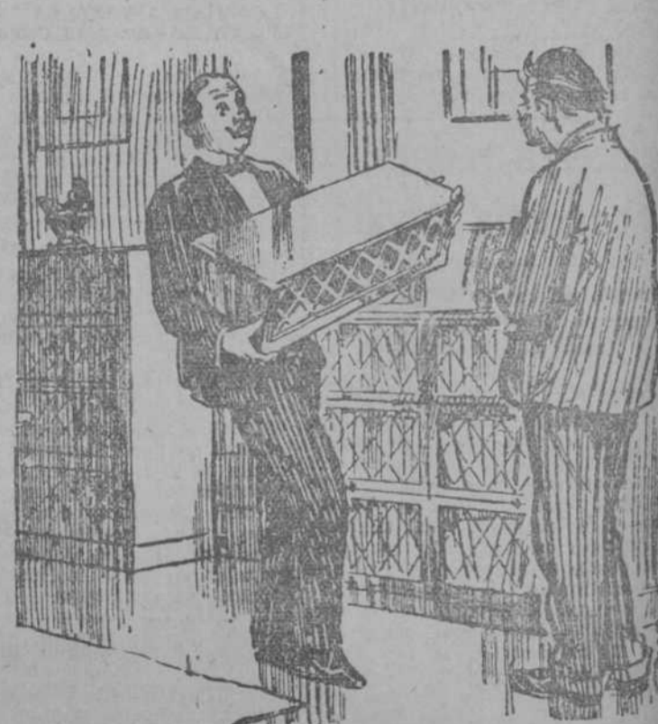
EL PACIENTE PRESTADOR DE LIBROS.—Hombre, llévate esta parte del estante para que guardes los libros que te he prestado. (The Humorist, Londres.)