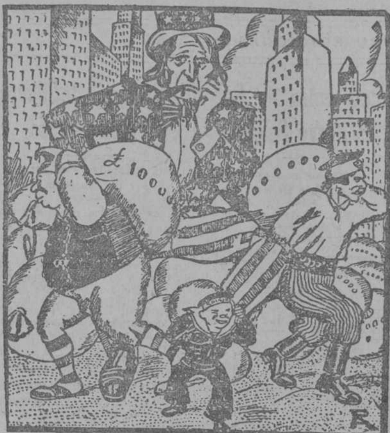
EL TIO SAM.—Bueno, ¿y a quién le presto yo este dinero ahora?