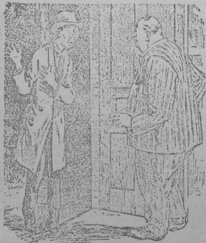
—Doctor, mi sobrino se ha tragado la llave de la puerta. Calcule qué tragedia; no podemos entrar en casa. (Sidney Bulletin, Sidney.)