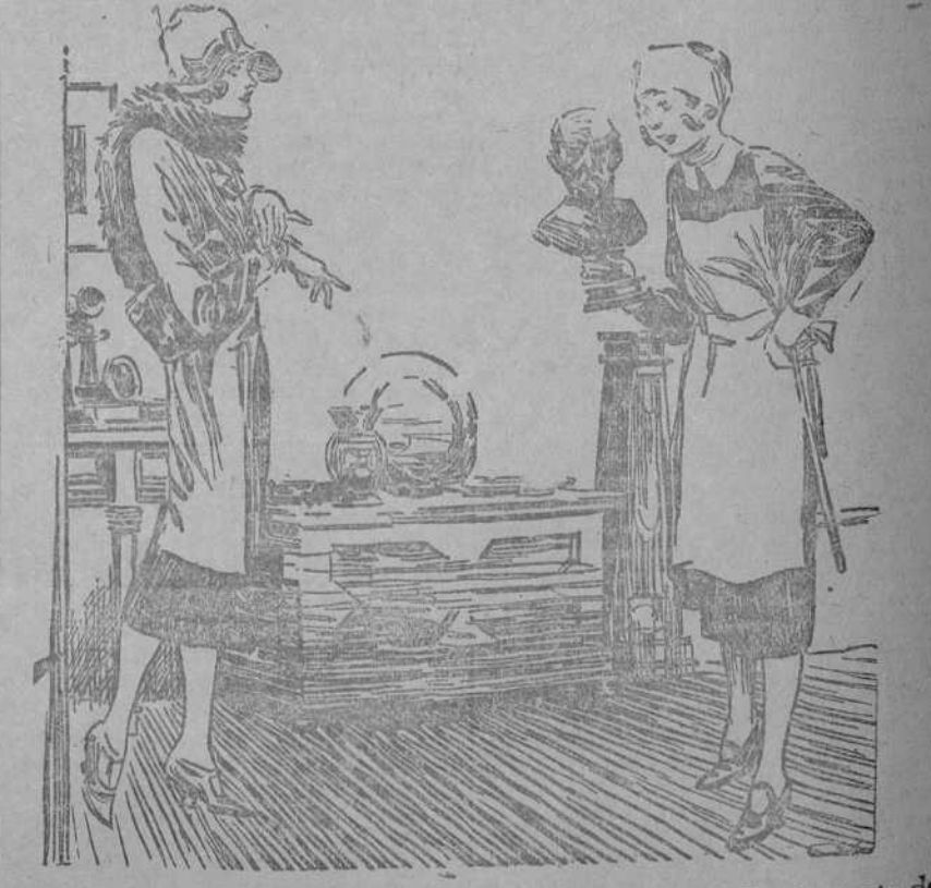
—Lleve mucho cuidado con ese busto de bronce. Es el retrato de mi abuelo. —¡Qué atrocidad! Debía ser un señor muy moreno. (The Humorist, Londres.)