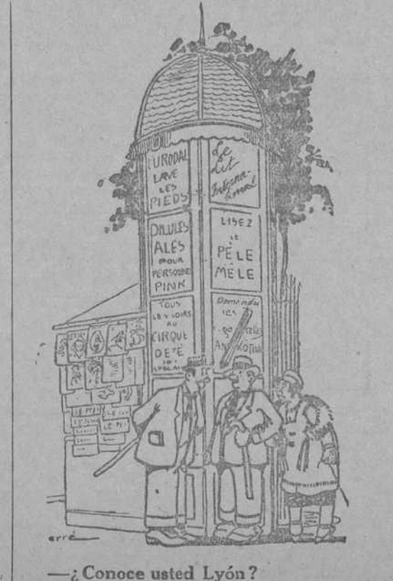
—¿Conoce usted Lyon? —Sí; allí conocí a mi mujer. —¿Y qué le parece a usted aquello? —Hombre, yo no he encontrado nunca nada interesante. (Pele-Méte, París.)