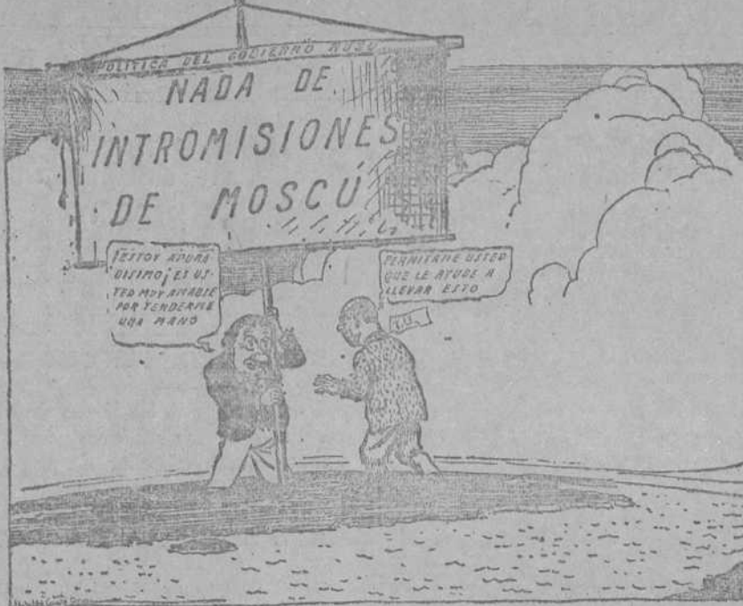
UN APOYO INESPERADO