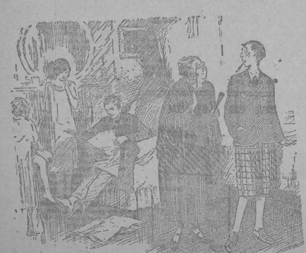
LA VIEJA MIOPE.—¿De modo que usted es el novio de Luisita? (Gaiety, Londres.)

BERLIN, 23. —Se sabe que Ludendorff, que asistió el domingo a la ceremonia celebrada en Tannenberg, lo hizo con la condición de no sentarse al lado del mariscal Hindenburg. Entre los dos generales media un profundo resentimiento, debido a que el presidente de la república se negó a visitar a Ludendorff durante su estancia en Baviera. Entre ambos no medió en Tannenberg otro saludo que el militar, sin que se dirigieran la palabra.