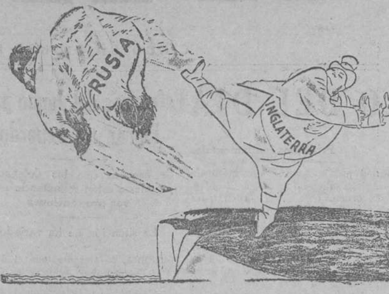
BAILES ANGLORRUSOS