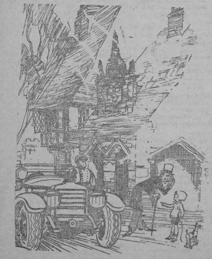
EL SEÑOR.—¡Hola, Tomasín! ¿Sabes quién soy yo? TOMASIN (hijo del chofer).—Sí; usted es el que va siempre en el coche de mi papá. (Passing Show, Londres.)

PARÍS. 2.—Telegrafían de Columbus (Ohio) al New York Herald que en una mina de la región entraron violentamente 200 mineros huelguistas, matando a un obrero e hirviendo a otros 16 que no habían abandonado el trabajo.