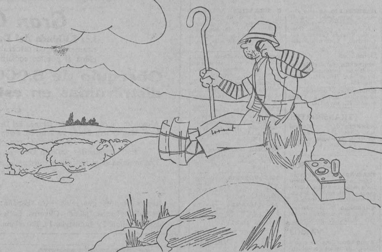
OVEJA PRIMERA.—No parece el mismo; antes, cuando decía que iba a coger la honda, ya tenía la piedra encima. Ahora dice que coge la onda, y como si nada.