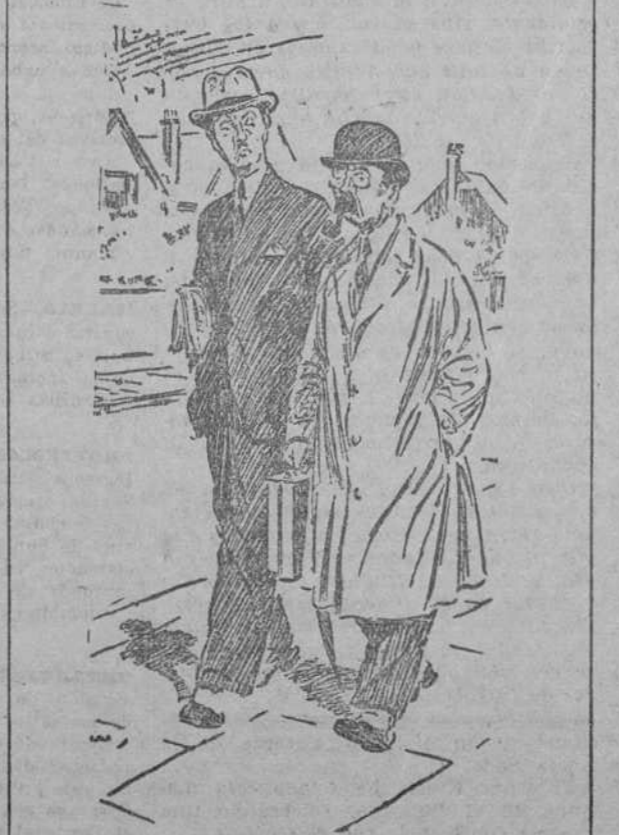
—¿No se va usted fuera este verano? —Todavía no lo sé. La familia ha decidido marcharse por entregas y yo soy la entrega final.