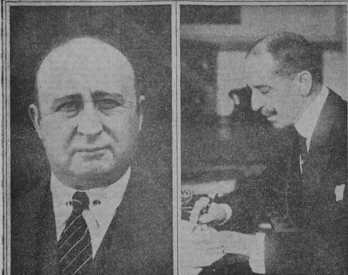
El duque de Medinaceli y el marqués de Bendaña, a quienes su majestad el Rey acaba de conceder el collar de Carlos III

tiempo. En consecuencia se acordó pedir al Gobierno la exención de subasta para realizar las obras por administración.