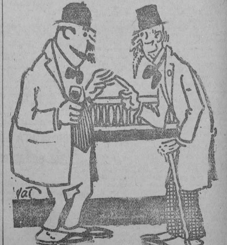
—Oye, tú; aquí, en el diario, hablan de mí. —¿Sí? ¿Qué dicen? —Verás: "Hallándose anoche un desconocido..." (Karlström, Oslo.)