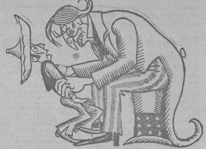
NICARAGUA.— ¡Qué dientes más largos tienes, tío Sam! TIO SAM.— Es para hablar mejor del desarme, hijita.