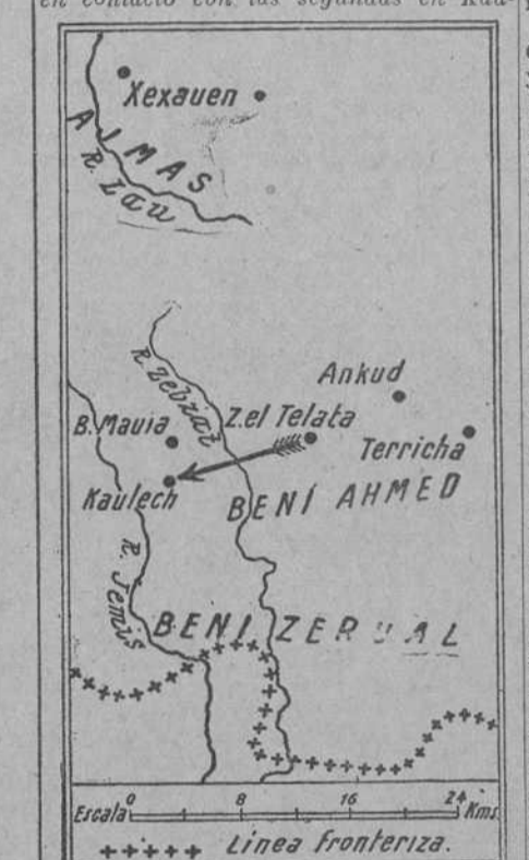
Nota de la Dirección de Marruecos y Colonias. Va a dirigir el nuevo ciclo de operaciones...