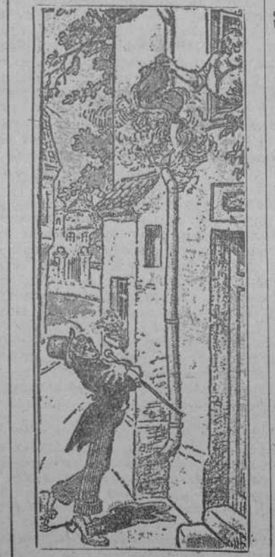
Narciso es tan corto de vista que cuando sacuden las alfombras cree que le hacen señas con el pañuelo. (Dorfbarbier, Berlín.)