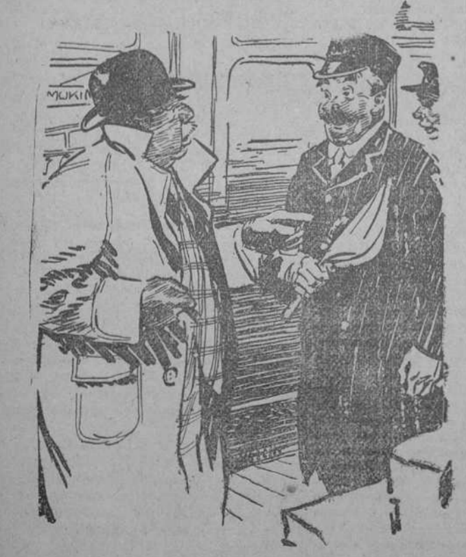
—Diga usted, ¿tendré tiempo de ir a la cantina? EL JEFE DE LA ESTACION.—Sí, señor. Para más seguridad voy a tomar una copa con usted. (London Opinton, Londres.)

ACCIDENTE A SIKORSKI NEUVA YORK, 1.—Sikorski, el ingeniero polaco constructor del aeroplano de Bouck para la travesía del Atlántico, ha sufrido hoy un accidente al probar un hidrógeno. El aparato cayó cerca de la playa de Long Island. Los aviadores-Sikorski y dos mecánicos resultaron lesionados. LA MEDALLA DEL «PLUS ULTRA» A LINDBERGH La «Gaceta» publica hoy un decreto concediendo a Lindbergh la medalla de oro «Plus Ultra».