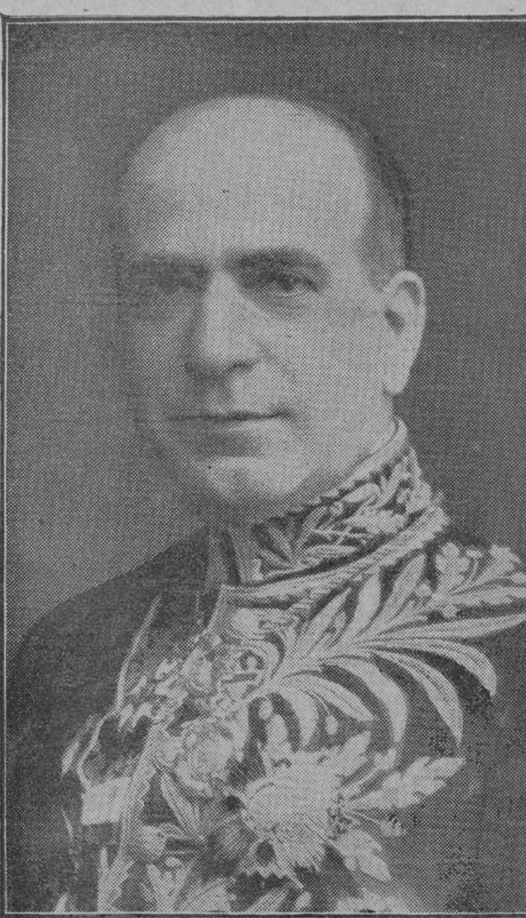
Excelentísimo señor don Benjamín Fernández Medina, ministro del Uruguay en España.