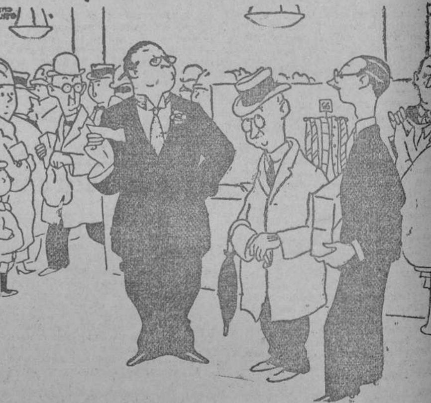
MINUTOS QUE PARECEN AÑOS. Cuando uno hace compras en una tienda y al dar el único billete que lleva le dicen que parece malo. (Table Talk, Melbourne.)