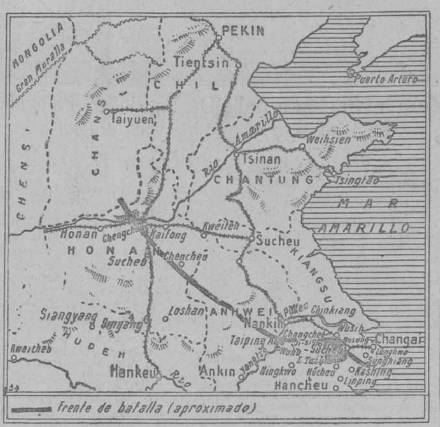
frente de batalla (aproximado)

El sábado las negociaciones francorussas PARIS, 16.—El próximo sábado continuarán sus trabajos en el Quai d'Orsay los delegados francorussos, miembros de la Conferencia relativa a la cuestión de las deudas.