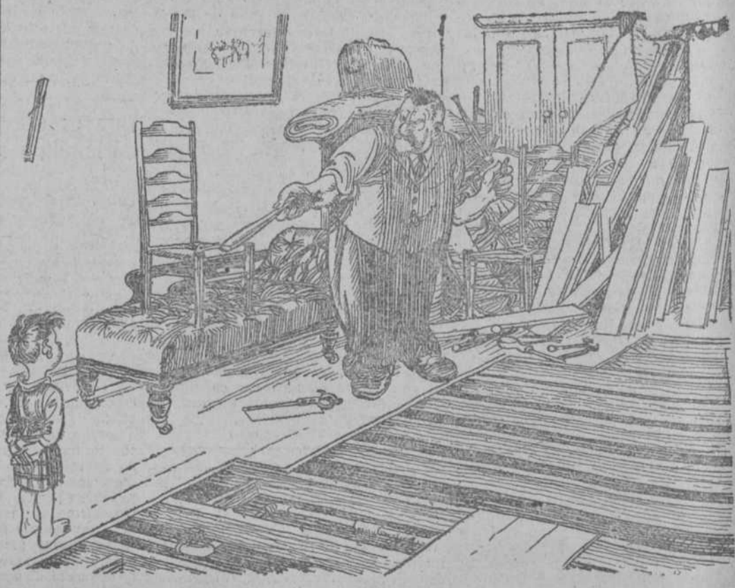
—Ya he encontrado la perra gorda; pero ahora me vas tú a pagar daños y perjuicios. (Passing Show, Londres.)