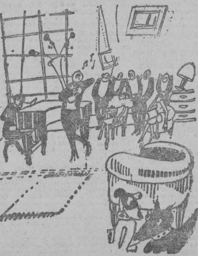
EL PERRITO BLANCO.—Oye, tú, ¡la paliza que nos das si chillamos como estos!