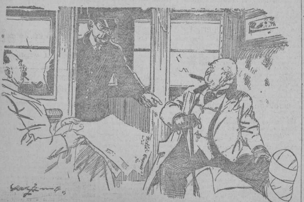
EL REVISOR MORE.—Caballero, ese bulto haga el favor de ponerle en la red. (Passing Show, Londres.)

Ninguno de ellos tiene nada que ver con su ilustre homónimo.