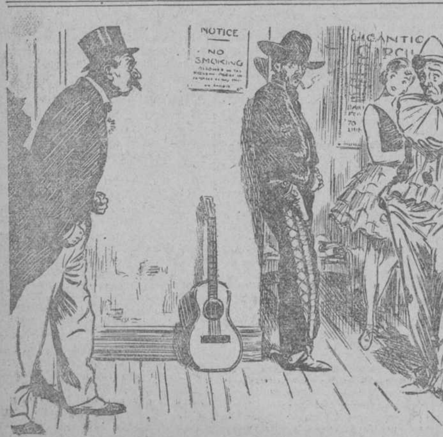
EL DIRECTOR DEL CIRCO.—¿Han visto ustedes por ahí al hombre sin huesos? Pues díganle que cuando lo encuentre no lo voy a dejar un sano.