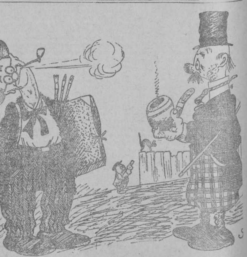
—¿Qué ha sido? ¿Algún aite? —No; es que vengo de pintar la torre de Pisa.