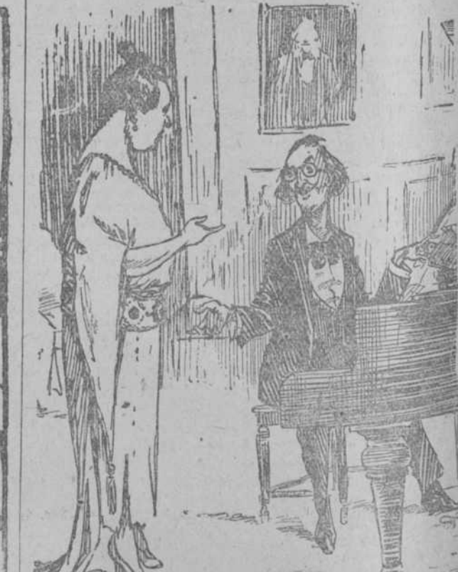
LA SEÑORA DE LA CASA.—Gracias por su hermoso concierto. ¿Qué le parece el piano? —¡Oh! No sé cómo se dice en correcto inglés; en mi país se llama «un cacharro».