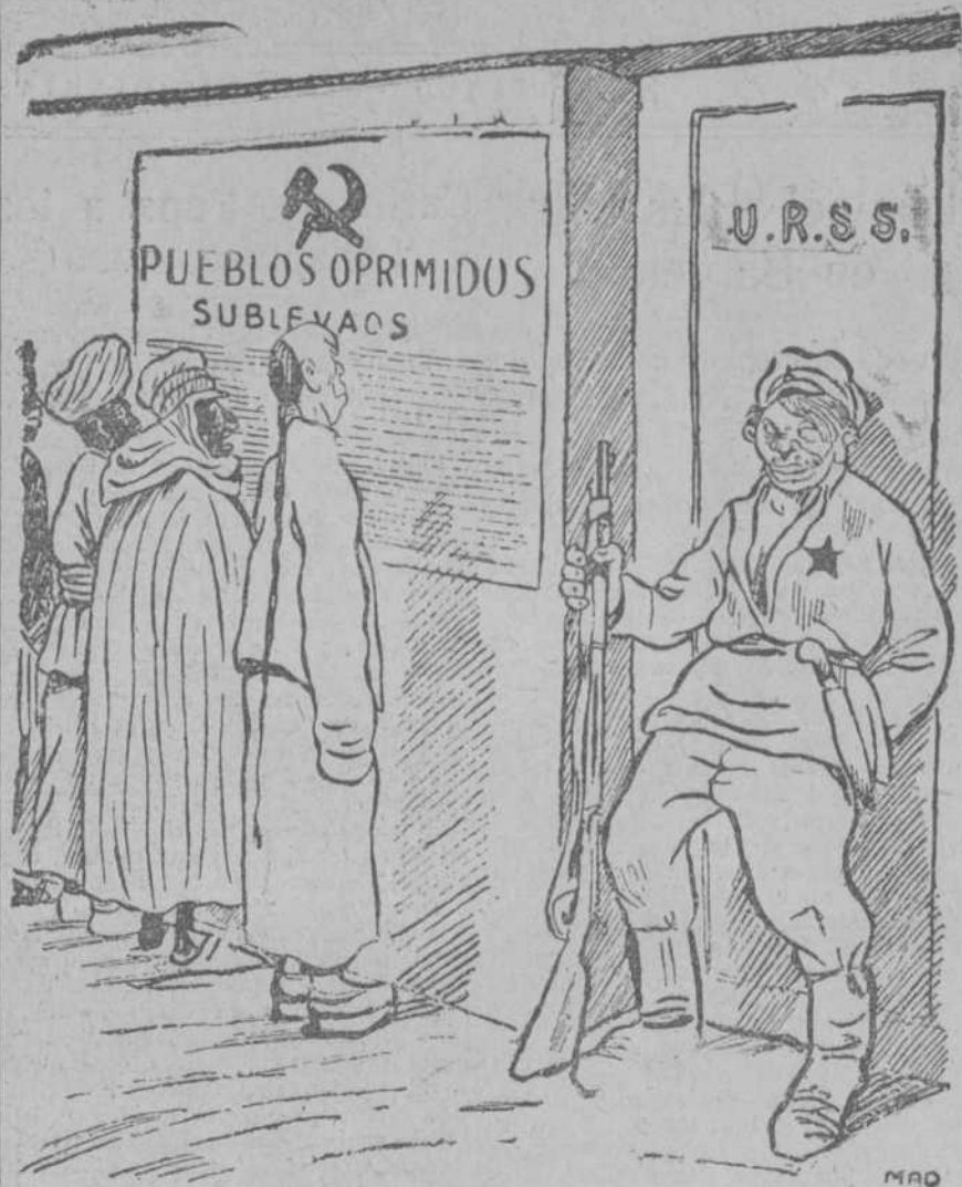
¡Afortunadamente, el pueblo ruso no sabe leer!