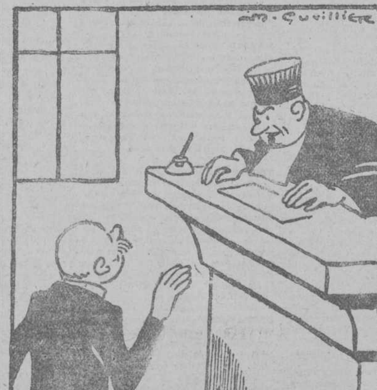
—¿De modo que usted agredió a su esposa con una botella de vino? —No, señor, no. Fué con media botella.