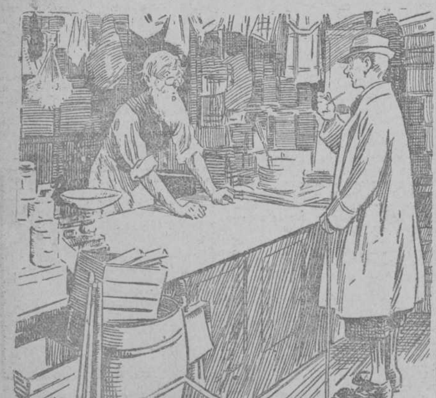
LA TIENDA DE PUEBLO (PANADERIA, DROGUERIA, PAÑERIA Y OBJETOS DE ESCRITORIO).—No; paches porosos, precisamente se me han terminado; pero tengo unos papeles cazarmoscas que, aplicados en el pecho, le han de dar un resultado muy semejante.

Acaba de publicarse la tercera edición de «El régimen municipal de la ciudad moderna», por don Adolfo Posada. Precio en Madrid 12,50 pesetas. Para envíos por correo, agregad 0,50. Librería General de Victoriano Suárez, Preciados, 48.