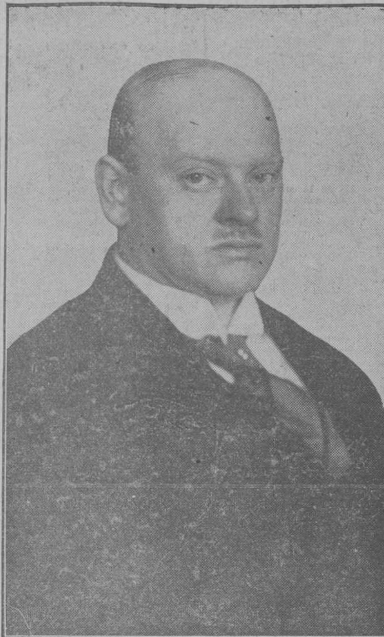
Gustavo Stressemann, ministro de Negocios Extranjeros alemán, que por primera vez presidirá el Consejo de la S. de N.

El nombre de Stressemann va unido a la política de aproximación franco-alemana iniciada en Locarno y proseguida en Thoiry. Sin embargo, es seguro de que el diplomático alemán no estará contento mientras no logre establecer las condiciones de una rápida evacuación de la región renana. La tarea ha de ser difícil y digna de quien se proclama, y la opinión así lo considera, el mejor discípulo de Bismarck.