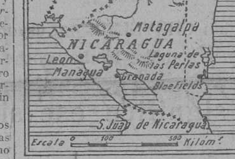
Map showing Honduras, Nicaragua, and surrounding regions.

WASHINGTON, 22.—A propuesta del departamento de Estado, ha zarpado con rumbo a La Ceiba (Honduras) un buque de guerra americano para proteger las vidas y haciendas de los súbditos extranjeros.