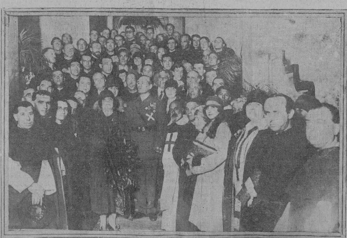
El coronel Millán Astray con la columna española que asistió a la fiesta organizada en su honor por la Casa de España en Roma, donde el jefe del Tercio dió una conferencia sobre su vida de soldado. La fotografía reproduce el momento de serle entregado un ramo de laurel del Monte Palatino.