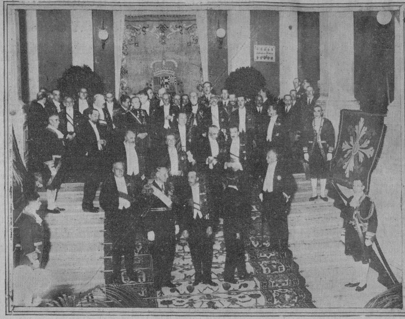
El Rey, el infante don Alfonso y el presidente del Consejo, con los asistentes a la comida de anteañoche en el ministerio de Estado, ofrecida por el Gobierno a los delegados en el Congreso Iberoamericano de Aeronáutica.