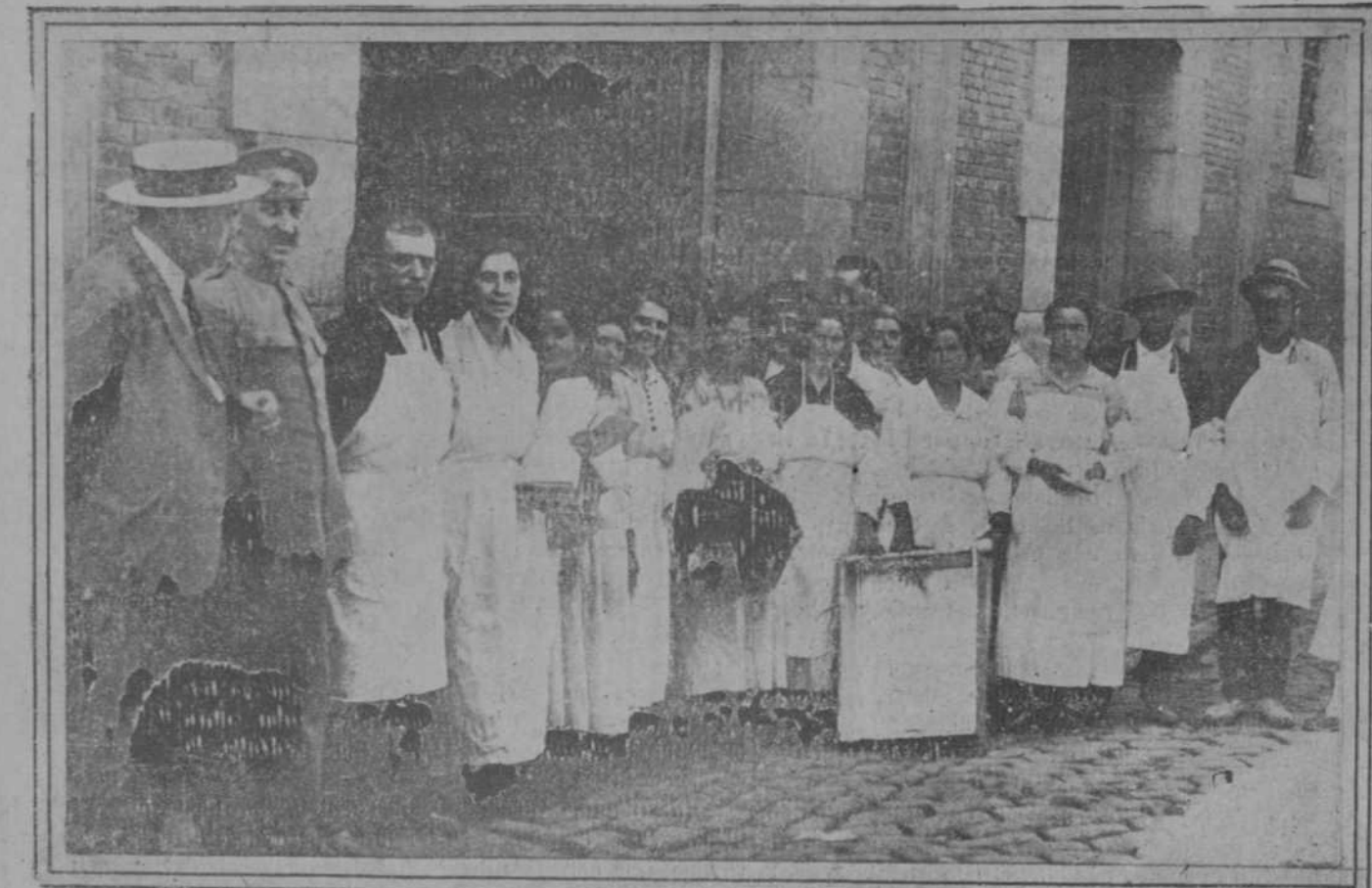
Los vendedores ambulantes de pescado del mercado de los Mostenses con el uniforme impuesto por el concejal delegado de abastos, señor Garcilaso de la Vega