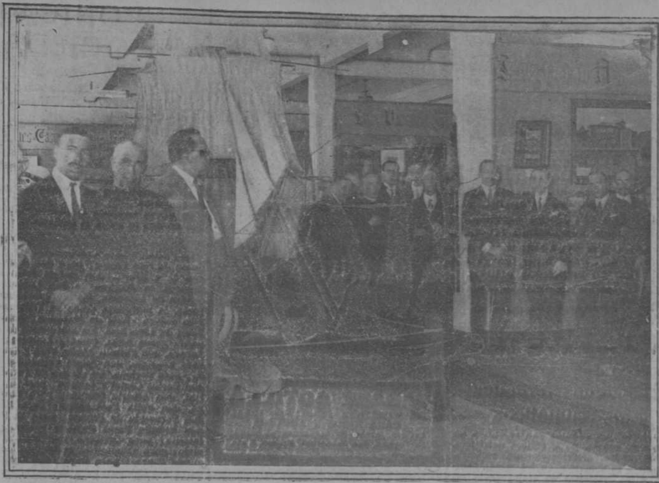
Su majestad inaugurando en el Ateneo la Exposición de Santander de antaño