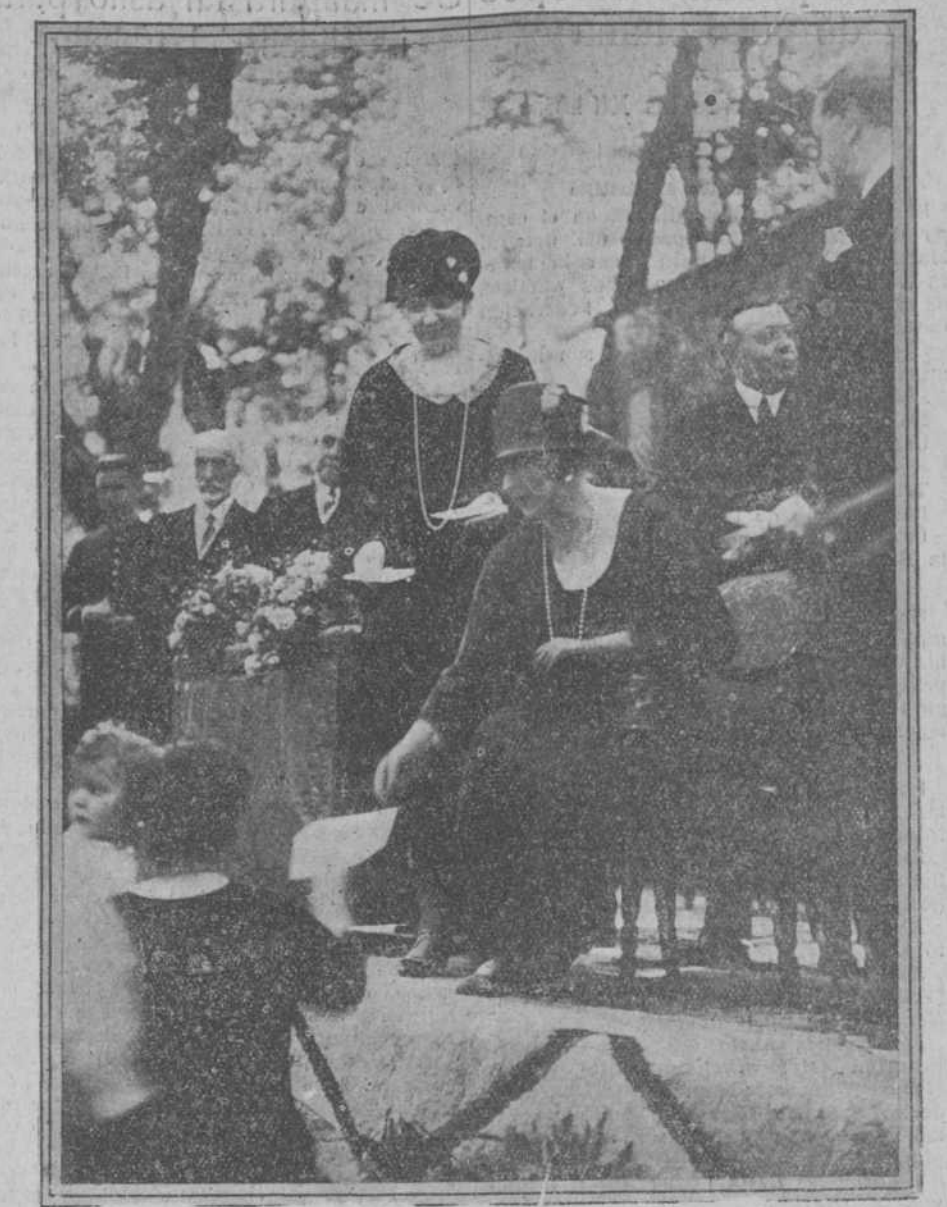
Su majestad la reina doña Victoria entregando los premios a las madres de niños lactantes acogidos en la Institución de Puericultura.