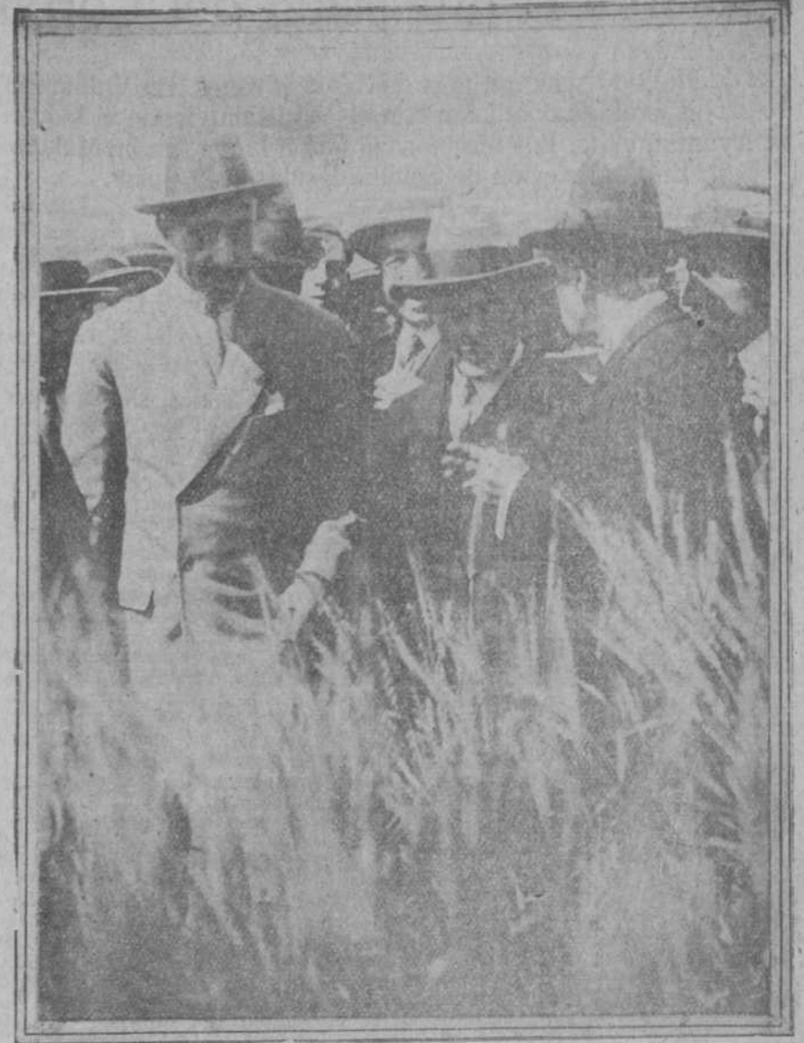
Su majestad el Rey con algunos de los asistentes a la conferencia que ayer mañana dio en la Casa de Campo el señor Arana.