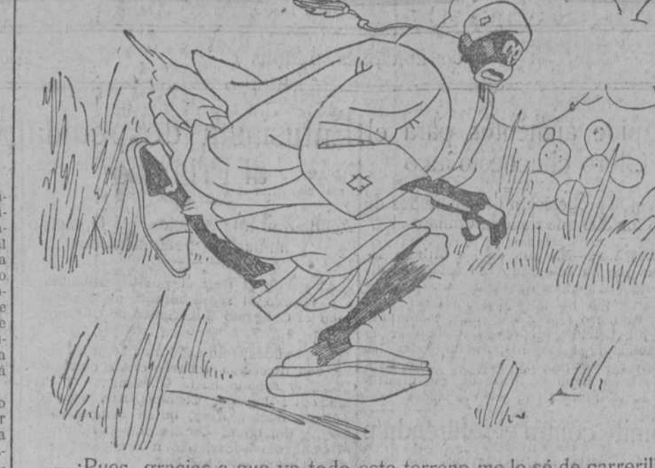
—¡Pues, gracias a que yo todo este terreno me lo sé de carrerilla!