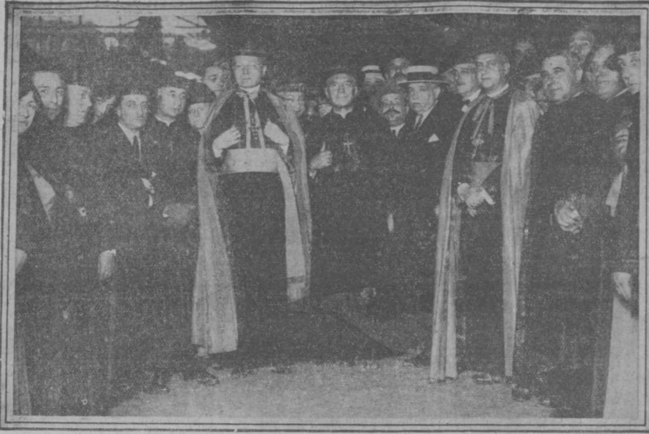
El Nuncio Apostólico, monseñor Tedeschini; el Obispo de Madrid Alcalá, doctor Eijo, y otras personalidades despidiendo en la estación del Norte al eminente Cardenal Primado, doctor Reig, que anoche marchó con dirección a Chicago.