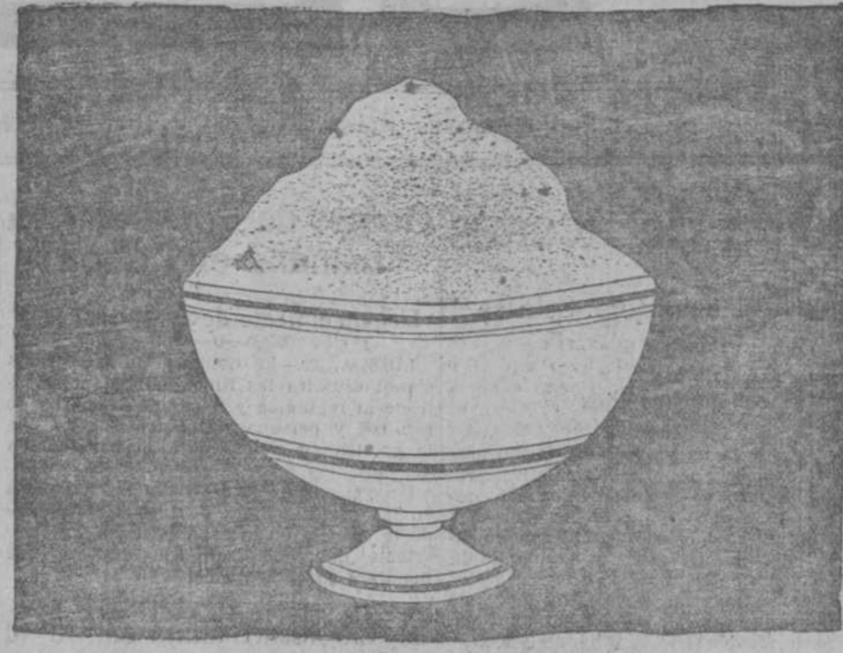
Azúcar de Tazza