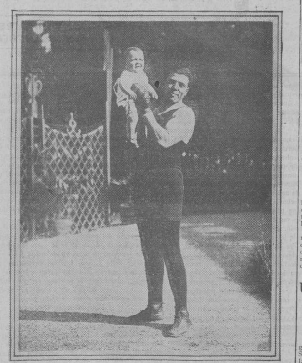
Ermínio Spalla, el boxeador italiano, con su hijo. Spalla, campeón de Europa, luchará con el español Uzcudun el próximo día 15