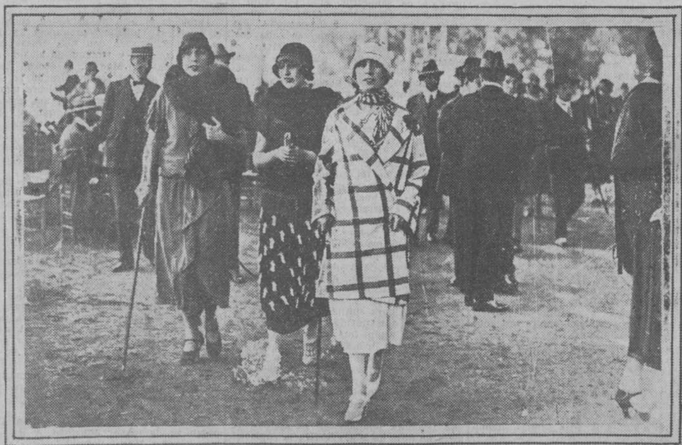
Distinguidas señoritas sevillanas, con elegantes y correctos vestidos, paseando por el Hipódromo de Tablada