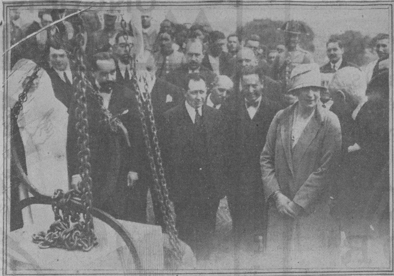
Su majestad la reina doña Victoria en el Sanatorio Victoria Eugenia, de Valdelatas, donde ayer se celebró el acto de colocar la primera piedra de dos nuevos pabellones