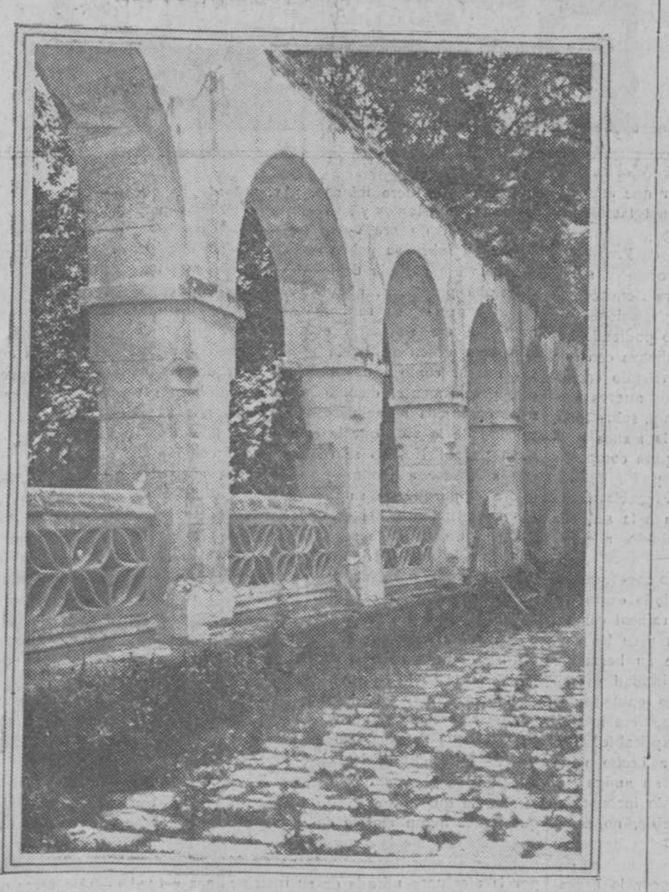
Detalle del claustro central del monasterio del Perral en Segovia, cuyo estado ruinoso demanda urgentemente obras de reparación