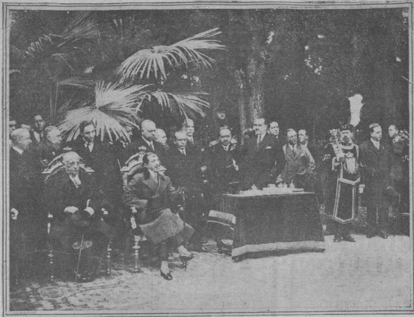
El Rey y las autoridades momentos antes de descubrir en el Retiro el monumento a don Santiago Ramón y Cajal.